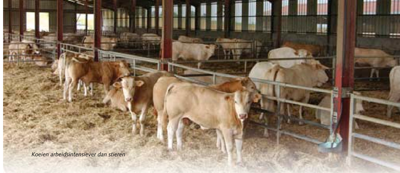
Koeien arbeidsintensiever dan stieren

In vergelijking met vroeger is het belang van economisch fokken verder toegenomen. 'De échte blonde, die zoeken we in de fokkerij.' Die cryptische omschrijving van Bouas verdient meer uitleg. 'Wij wil-