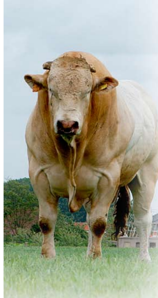
Maorizoon Zandvelder Veto, kampioen stieren op blondeshow tijdens de afgelopen Agriflanders

werkt met één natuurlijk dekkende stier en dat hij minimaal gebruikmaakt van kunstmatige inseminatie. 'Je hoort soms fokkers die vier of vijf verschillende stieren inzetten. Dat is hier nog nooit het geval geweest, vroeger niet en nu niet. Nee, geef mij maar gewoon één stier die de moederlijn kan verbeteren.'