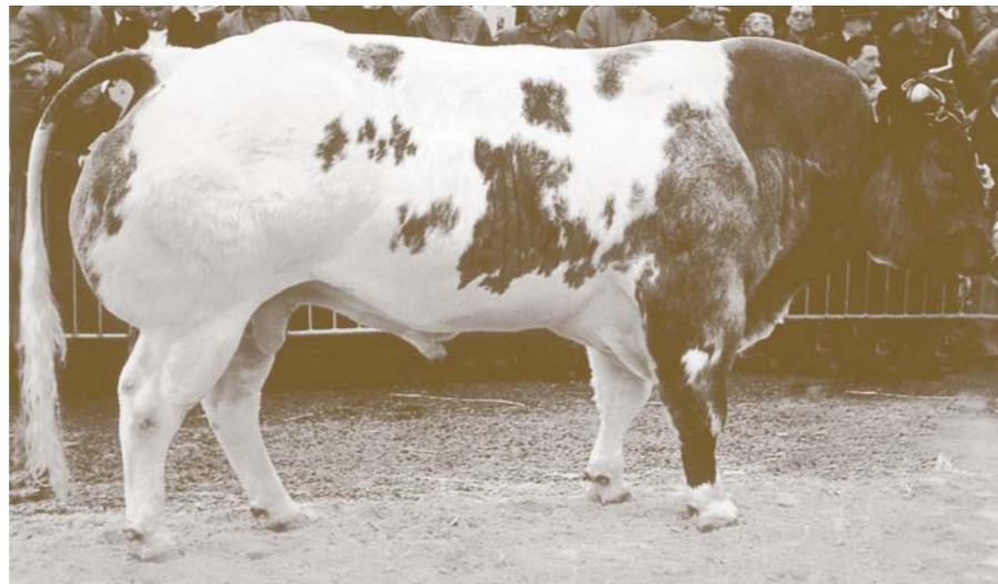
Galopeur des Hayons