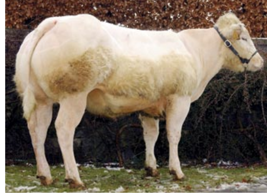
Nazaten van Bourgeois hebben lange, fijne botten, een sterk hellend bekken en een volbespiede broek

van 87,2 punten, met 75 voor hoogtemaat, 88,7 voor bespieren, 81,7 voor type, 100 voor beenwerk en 80 punten voor algemeen voorkomen. Moedersmoeder Orientation (v. Urbi de Bois Borsu) was een fijn beveesde koe. Serieuse was haar enige kalf, omdat de koe afgevoerd diende te worden vanwege een ongeluk op de weide.