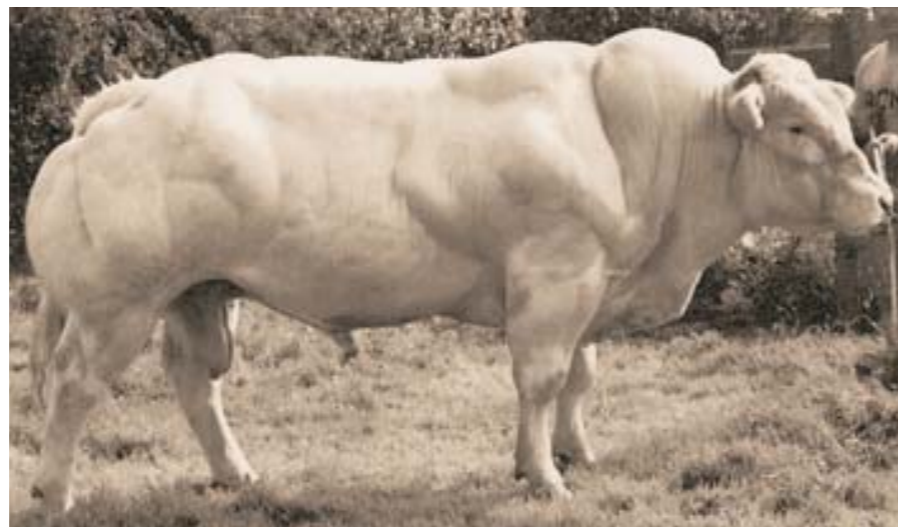
Opticien d'au Chêne