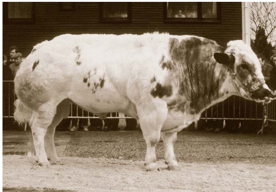
Riant heeft veel excellente zonen nagelaten