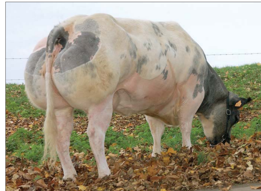
Giboulée de Saint Fontaine vertegenwoordigt Elan op Agribex 2005

Voor hij met zijn betoog verdergaat, verschijnt ook de lineaire beoordeling van Elans moeder op tafel. 'Aspirine was een fokkoe met genoeg hoogtemaat', verwijst hij naar de cijferreeks. In totaal kreeg de Radar de Saint Fontainedochter een totaalscore van 87,6 punten, opgebouwd uit 88 hoogtemaat, 87,2 bespierung, 82,4 vleestype, 94 benen en 80 algemeen voorkomen. 'Haar sterkste punt was ongetwijfeld benen.'