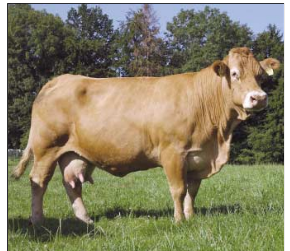
Odilusdochter Odile winnares Old Ladies Cup 1999