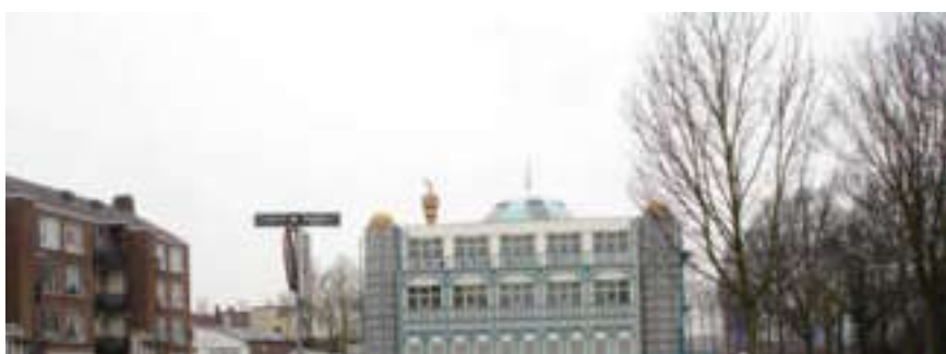
Utrecht, februari 2007: Moskee.

Ruimte kan effectiever gebruikt worden. De bestaande infrastructuur moet multifunctioneel gebruikt worden: aan een plek kunnen verschillende functies gegeven worden. Muren kunnen klimmuren worden, hellingen bij viaducten kunnen voor skaten gebruikt worden. Omdat auto's een buitenproportionele hoeveelheid ruimte innemen, worden vooral hiervoor alternatieven gezocht.