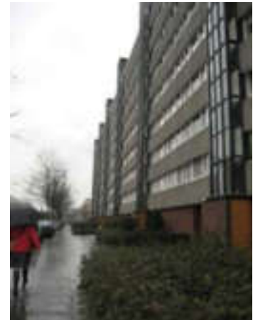
Utrecht, februari 2007: Wonen centraal.

De positieve eigenschappen/vaardigheden van sommige bewoners moeten naar voren gehaald worden. Sommige bewoners kunnen anderen stimuleren met hun enthousiasme voor een hobby, een sport of