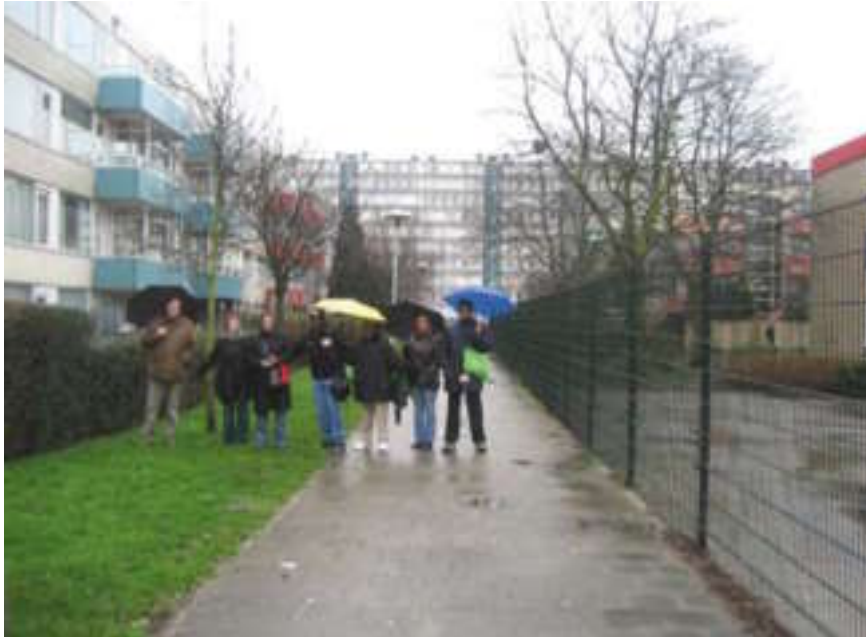
Utrecht, februari 2007: Buitenlandse deskundigen bekijken een wijk.

ten van een Gezonde Wijk (zie hoofdstuk 2). Deze lijst is gebruikt om de beste ideeën te selecteren en verder uit te werken (zie hoofdstuk 3).