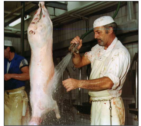
Er zijn ook regels voor het slachten van dieren.

zaad van het mannetje. Dit heet kunstmatige inseminatie (k.i.). In de GWWD staat welke voortplantingstechnieken mogen worden gebruikt en wie die technieken mag toepassen (bijvoorbeeld de boer zelf of de veearts). Daarnaast zijn er regels voor het ritueel slachten van dieren. Dieren worden bij het slachten meestal eerst bedwelmd, zodat ze geen pijn meer voelen. Maar in sommige godsdiensten mag dat niet, dieren moeten dan volgens bepaalde regels - rituelen - geslacht worden. Ook bij ritueel slachten moet er alles aan gedaan worden om te voorkomen dat de dieren pijn lijden. Ook staan in de GWWD regels voor het exporteren van dieren naar het buitenland. Dit zijn administratieve regels, ze gaan over welke documenten je nodig hebt om te exporteren.