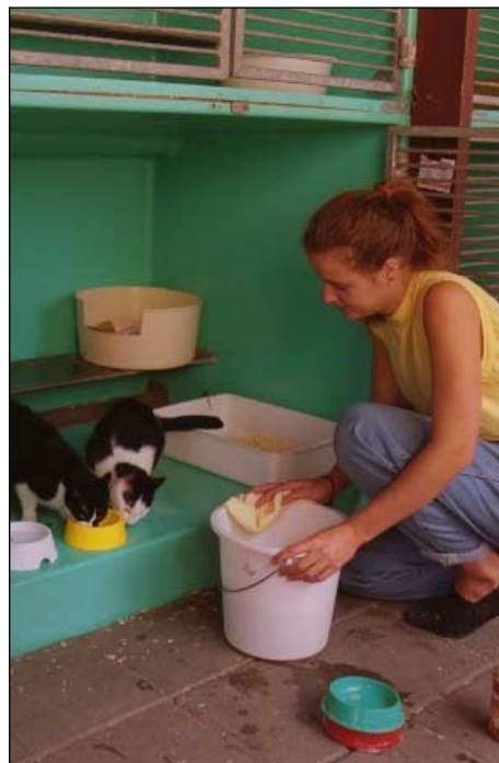
Katten in een asiel; ook hier moeten ze goed worden verzorgd.

Verder gelden de regels over ingrepen uit hoofdstuk 3 ook voor huisdieren. Je mag bijvoorbeeld de vleugels van een papegaai niet leewieken (een stukje van het bot weghalen, zodat hij niet meer kan vliegen). En vanaf september 2001 mogen staarten van honden niet meer afgeknipt worden. Ook zijn er huisvestingsregels voor huisdieren die bedrijfsmatig worden gehouden. Deze regels gelden voor bijvoorbeeld asiels, dierenpensions en hondenkennels.