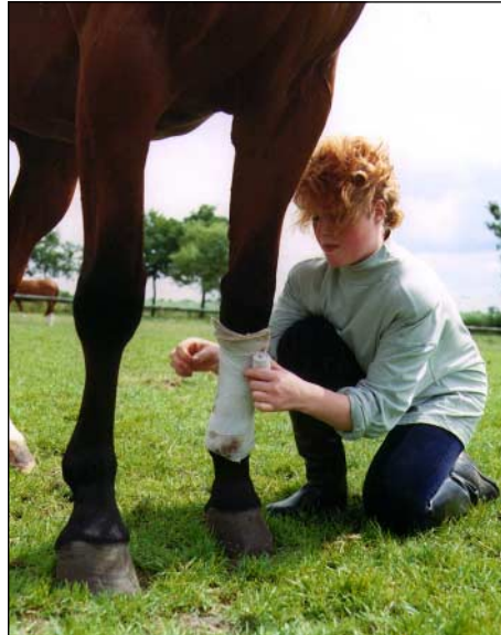
Iedereen is verplicht een hulpbehoevend dier zorg te verlenen.