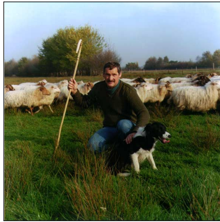
Bij de eerste wet die dieren beschermde, was het dier niet belangrijk.

Bij de eerste wet die dieren beschermde was het dier niet belangrijk. In 1886 werd in het Wetboek van Strafrecht mishandeling van een dier strafbaar gesteld. De reden hiervoor was dat de 'zedelijke gevoelens' van mensen die de mishandeling moesten aanzien of aanhoren werden gekwetst. Het ging dus niet om het lijden van de dieren door pijn, honger of dorst, maar om de mensen die dat lijden niet konden aanzien en medelijden met de dieren kregen.