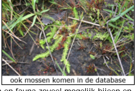
ook mossen komen in de database

In e-mailnieuwsbrief 15 stond in het bericht 'Ministerie zet databank flora en fauna op' niet alle informatie geheel juist weergegeven.