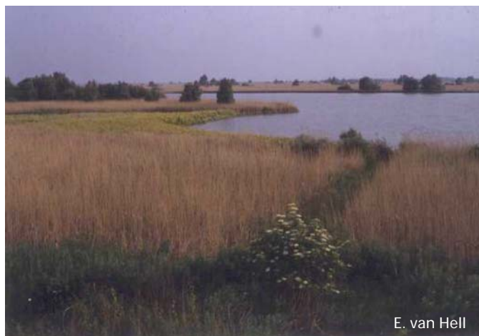
E. van Hell

Om de stand van de grote karekiet te herstellen is uitbreiding van het areaal waterriet nodig. Daarvoor is een natuurlijk peilbeheer en het verbeteren van de waterkwaliteit het belangrijkste. Daarnaast is het beheer van het riet van belang. Te intensief rietmaai-beheer leidt tot het verdwijnen van overjarig riet, het ontbreken van beheer leidt tot verruiging en verbossing. Het verbeteren van de waterkwaliteit leidt tot een verbetering van het aanbod grote insecten, zodat het voedselaanbod groter wordt.