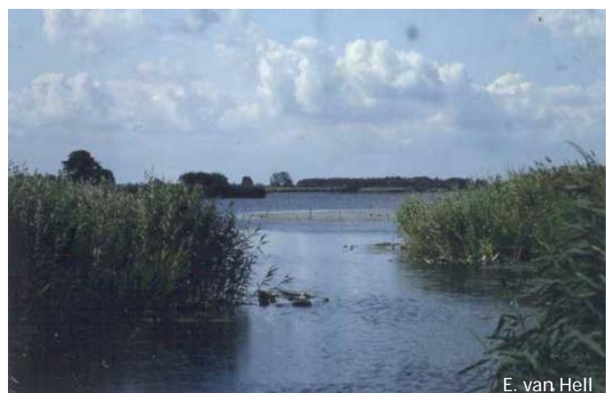
E. van Hell

De hoeveelheid geschikt habitat kan worden vergroot door de ontwikkeling van jonge verlandingen. Daarnaast is voldoende variatie in de moerasvegetaties te bereiken door het toelaten van meer dynamiek en het verbeteren van de waterkwaliteit. In het rivierengebied biedt natuurontwikkeling nieuwe kansen als er voor wordt gezorgd dat kreken en geulen een goed ontwikkelde oevervegetatie krijgen.