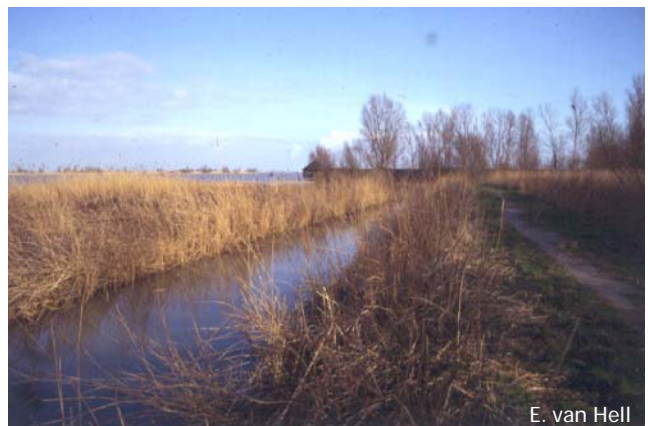
E. van Hell

De belangrijkste broedgebieden van de purperreiger liggen in het Hollands-Utrechtse veenweidegebied en in NW-Overijssel. Tot aan het begin van de twintigste eeuw had de soort sterk te lijden van vervolging door de mens. Het volledig beschermen van de soort leidde tot een uitbreiding vanuit Midden-Nederland en Overijssel tot in Friesland, waar nu de meest noordelijke purperreigerkolonies ter wereld liggen. In de jaren zeventig broedden gemiddeld 700 paren in ons land, daarna was er sprake van een gestage afname tot 200 à 300 paar begin jaren negentig van de vorige eeuw. In 2000 waren er echter weer ca. 400 broedparen.