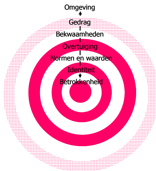
Figuur 2. Het Ui-model van Korthagen

De huidige invoering en discussie over competentiegericht beroepsonderwijs gaat volgens mij te veel voorbij aan dit wezenlijke vraagstuk als het gaat om beroepsvorming tot vakmanschap. De discussie beperkt zich te veel tot de buitenkant van de persoon. Korthagen (2004) wijst erop dat het gevaar groot is dat tot in den treuren wordt uitgewerkt aan welke kennis en kunde deelnemers aan het beroepsonderwijs moeten voldoen. Bovendien is volgens hem de kans groot dat men hierbij verzandt in telefoonboeken vol specificaties van deelkwalificaties of dat men niet verder komt dan vage algemene compromissen die te weinig houvast bieden voor valide en betrouwbare toetsing van competenties. In plaats van gemotiveerd te werken aan de eigen beroepsvorming, zullen deelnemers van het mbo zich slaafs richten naar de opgestelde eindtermen en zullen ze afvinken aan welke competenties ze reeds voldoen. Er is dan eerder sprake van deprofessionalisering dan van professionalisering. Hij pleit ervoor om de persoon en beroepsvorming of professionalisering meer met elkaar te verbinden. Dat kan door