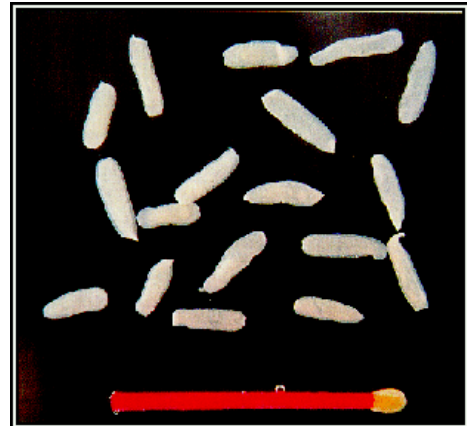
Rijpe segmenten van de hondenlintworm

Er wordt gespeculeerd over het binnendringen van Toxocara -larven in de hersenen van kinderen en epilepsie. In oudere kinderen en volwassenen kunnen de larven naar de ogen migreren waar het netvlies beschadigd kan worden (Marx, 1991). Uit bloedonderzoek is gebleken dat 5 tot 10% van de Nederlandse bevolking wel eens een besmetting met Toxocara heeft doorgemaakt. De immunologische reactie op VLM is identiek aan die op astma, en astmaproblemen kunnen door een Toxocara infectie verergeren. Jonge kinderen zijn een risicogroep voor deze infectie, omdat zij meer contact hebben met grond en minder op hygiëne letten dan volwassenen. Omdat wormen dus ook bij mensen voor matig tot ernstige ziektebeelden zorgen, is het belangrijk honden en katten minstens 2 keer per jaar te ontwormen en puppies vaker (Marx, 1991), vooral wanneer er kleine kinderen in de buurt van het dier zijn. Bij het bestrijden van wormen hoort ook het bestrijden van tussengastheren zoals de