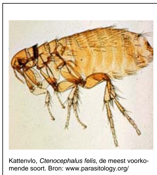
Kattenvlo, Ctenocephalides felis , de meest voorkomende soort.

Vlooien zijn kleine vleugelloze insecten die zich vastbijten in de huid van de gastheer. Dat doen zij overigens alleen om zich te voeden, en dan nog alleen de volwassen insecten. De meest voorkomende soort op alle huisdieren, ook landbouwhuisdieren en op de mens zelf, is de kattenvlo Ctenocephalides felis . Het overgrote deel van de vlooien zit in de omgeving en niet op het dier zelf. Een vlo kan wel honderden eieren op een dag leggen, die jaren later nog kunnen uitkomen. De lichtschuwe vlooienlarve voedt zich in eerste instantie met dood organisch materiaal en verpopt zich na drie vervellingen. Ook het popstadium kan heel lang overleven. Uit de pop komt tenslotte een hongerige vlo, die na elke bloedmaaltijd eieren begint te leggen. Vlooienplagen treden meestal op bij warm weer. Elke huisdierbezitter heeft wel eens te maken met vlooien,. Wanneer het huisdier last heeft van vlooien, zijn er vaak kleine bruine korreltjes, dat zijn vlooienuitwerpselen, zichtbaar tussen de haren en krabt en schuurt het dier zich vaak vanwege de jeuk..U kunt vlooien ook vinden door met een vlooienkam het dier te kammen.