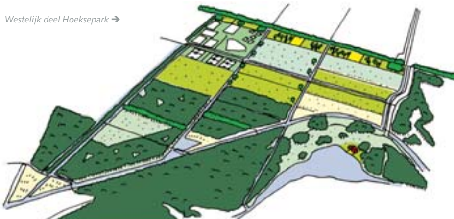
Westelijk deel Hoeksepark →

Het oostelijke deel blijft voorlopig bestemd voor landbouw. Op termijn wordt de intensieve landbouw omgevormd naar extensieve landbouw en/of agrarisch natuurbeheer met natte graslanden en moeraszones. De mogelijkheden om het gebied te doorkruisen blijven beperkt om de natuur een goede kans te bieden. De openheid en de natuur zullen met name vanaf de rand en spaarzaam in het gebied te beleven zijn. De twee delen vormen samen een afwisselend en contrastrijk park dat Bergschenhoek verbindt met de Rotte. Het biedt de bewoners in de nabije omgeving een mooie plek voor een rondje dichtbij huis of het begin van een tocht door het regiopark Rottemeren. «