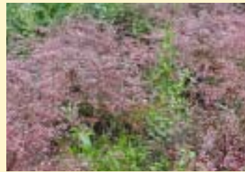
Onderhoudsniveau normaal. Heesters in woongebied.