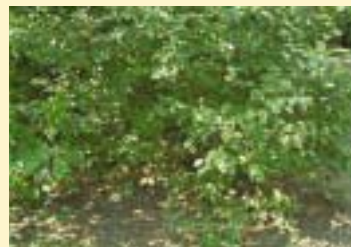
Onderhoudsniveau extensief. Heesters op industrieterrein.

Bij de groeninrichting van de openbare ruimte besteedt de gemeente de grootst mogelijke zorg aan een goed evenwicht tussen de gewenste uitstraling en de onderhoudskosten. Oftewel: speciale kweekrozen zijn prachtig, maar zeer intensief in het onderhoud en daardoor kostbaar. Botanische rozenstruiken gedijen daarentegen goed bij normaal of extensief niveau onderhoud.