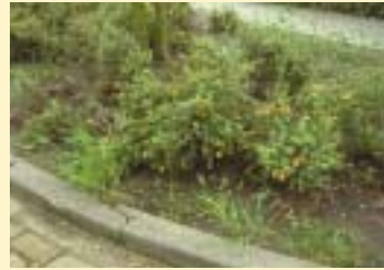
Onderhoudsniveau intensief. Heesters in winkelgebied.

Om te weten wanneer een bepaalde struik, boom of gazon (groenelementen) aan onderhoud toe is, kan de hiervoor aangewezen uitvoerende in een kwaliteitshandboek kijken. Dit handboek is door de gemeente opgesteld. Hierin staan foto's van alle voorkomende groenelementen en hun zogeheten ingrijp- of onderhoudsmomenten. We noemen dit: beoordelen op basis van de beeldkwaliteit. Op de bovenste foto bij dit stukje tekst ziet u heesters in een winkelgebied in Waalwijk met onderhoudsniveau intensief. Zoals dit beeld laat zien moet de onderhouder al ingrijpen wanneer hij enkele plukjes gras en onkruid ziet opkomen. Bij de foto van de heesters op het industrieterrein ziet u dat het onkruid heel wat hoger mag staan, voordat de gemeente of aannemer volgens de foto moet ingrijpen. Door bij het onderhoud uit te gaan van de actuele beeldkwaliteit in plaats van een vastgesteld onderhoudsschema, houdt de gemeente Waalwijk de kwaliteit van de groenvoorziening met de juiste inspanningen op het juiste niveau.