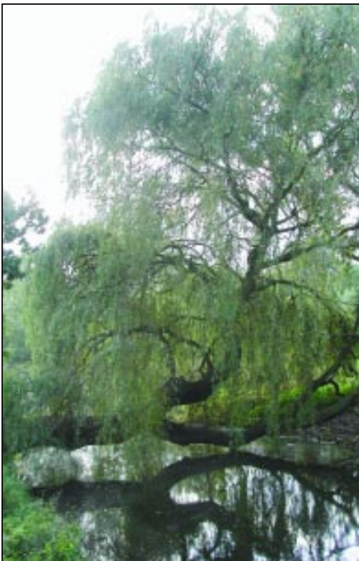
Speel- en klauterbomen hebben een bijzondere educatieve waarde. Deze treurwilg langs de Kometensingel tegenover huisnummer 427, vlakbij de Plejadenweg, is opgenomen in de lijst monumentale bomen van stadsdeel Noord.

Het beoordelen van en omgaan met monumentale bomen blijft — ondanks de criteria — onderhevig aan subjectiviteit. Daarom wordt aanbevolen om één keer per jaar onder leiding van de hoofdstedelijke bomenconsulent met alle betrokkenen in de stad bijeen te komen om aanpak en werkwijze op elkaar af te stemmen.