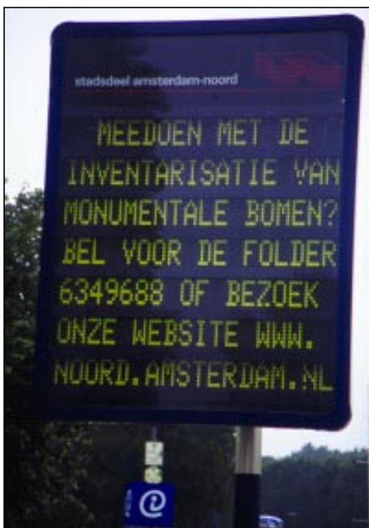
Bij een inventarisatieproject kan de afdeling Communicatie een waardevolle bijdrage leveren.

Deze afdeling zorgde onder meer voor persberichten en bewonersaankondigingen, een informatie-folder en een pagina over monumentale bomen op de website van het stadsdeel, het redigeren van teksten en het inschakelen van specifieke deskundigheid. Verder leverde Communicatie toegang tot adressenbestanden en de eigen communicatiemiddelen van het stadsdeel en adviseerde de afdeling bij vragen van de projectleider.