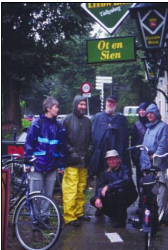
Bij de inventarisatie van de monumentale bomen in stadsdeel Noord namen bewoners deel aan de beoordelingscommissie.

De adviescommissie baseert zich op de verzamelde gegevens, de foto's én een bezoek aan de locatie. Vervolgens schrijft zij een advies aan het stadsdeel over welke bomen naar haar mening monumentaal, niet-monumentaal en, desgewenst, potentieel monumentaal moeten worden verklaard. Afhankelijk van de opdracht kan het advies van de adviescommissie ook aanbevelingen bevatten over bescherming, beheer en onderhoud van de monumentale bomen en over communicatie.