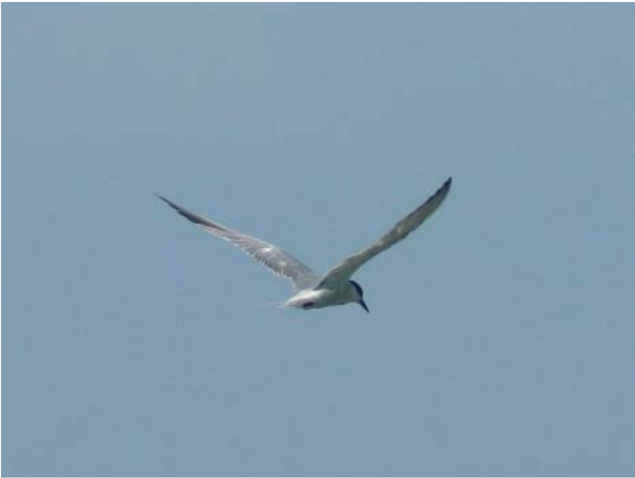
Foto 6: Visdief, bij uitstek een soort die profiteert van opgespoten terreinen als vervanging voor zijn oorspronkelijk broedbiotoop: kale zandbanken aan rivieren en zee.