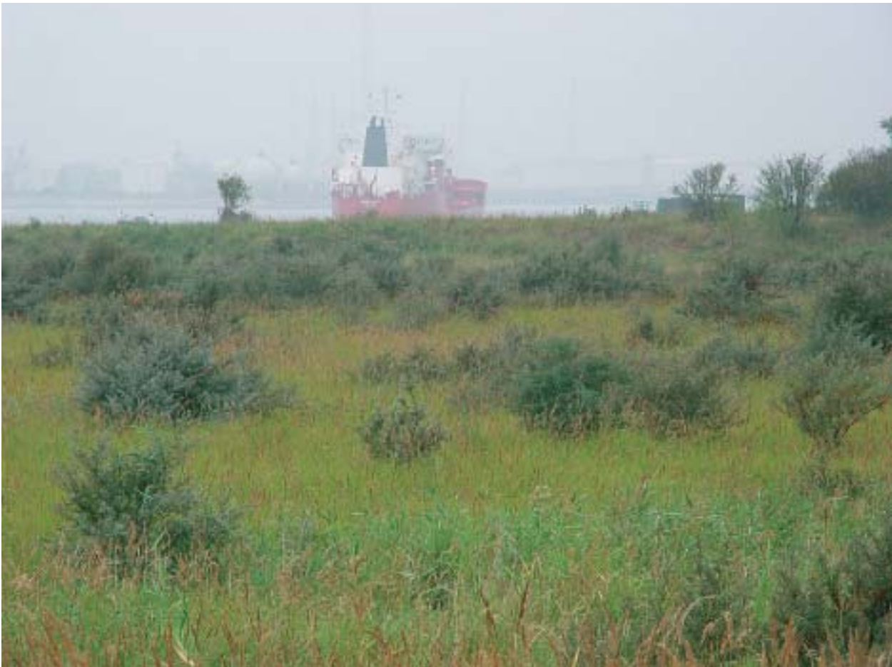
Foto 11: Na verloop van tijd komen in het huidige Nederlandse klimaat altijd bomen op waarna de soortensamenstelling in het tijdelijke natuurgebied drastisch verandert.

Met het staken van bemesting verschaalt en verzuurt de toplaag langzaam, waardoor het grasland na vele jaren ongeschikt wordt voor de graseters onder de watervogels. Pas in een laat stadium duiken bomen en struiken op en wordt het gebied geschikt voor soorten die hiervan afhankelijk zijn (boomkikker, grauwe klauwier, vleermuizen). In een later stadium ontstaan rietmoerassen die soorten als kraanvogel kunnen bevolken. In voormalige sloten kunnen gevlekte witsnuitlibel en groene glazenmaker opduiken in velden met krabbescheer. Kleine sloten groeien langzaam dicht en raken geïsoleerd, waardoor ze voor poelkikker interessant worden.