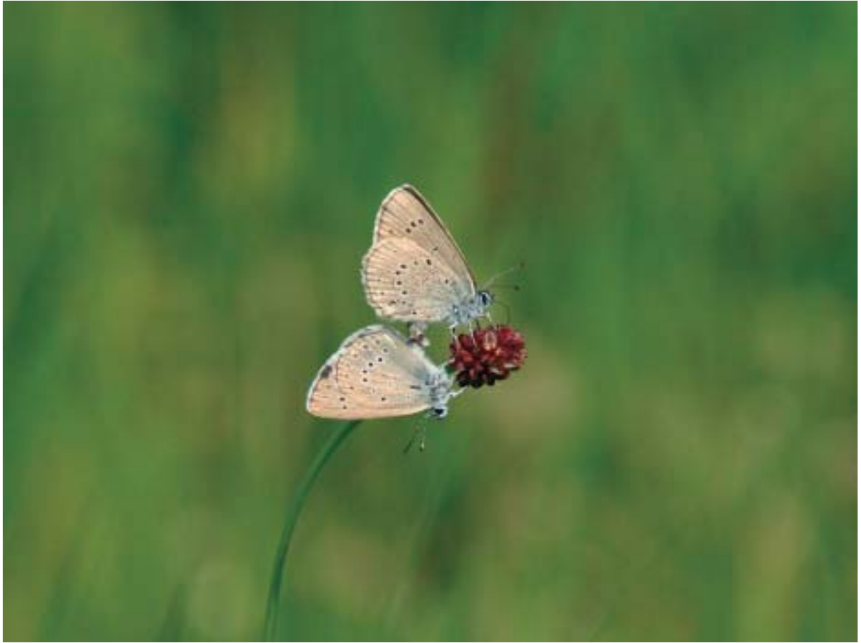
Foto 14: Pimpernelblauwtjes verschijnen pas als er grote pimpernel groeit met nesten van knooppieren in de directe omgeving.