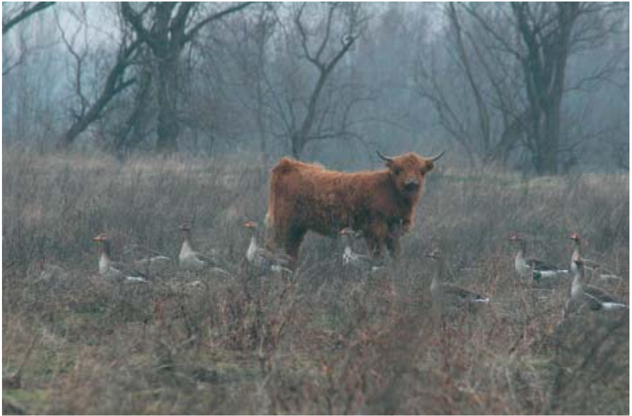
Foto 8: Spontane ontwikkelingen op een voormalige akker na één jaar: ruijgte, ganzen en veel muizen.