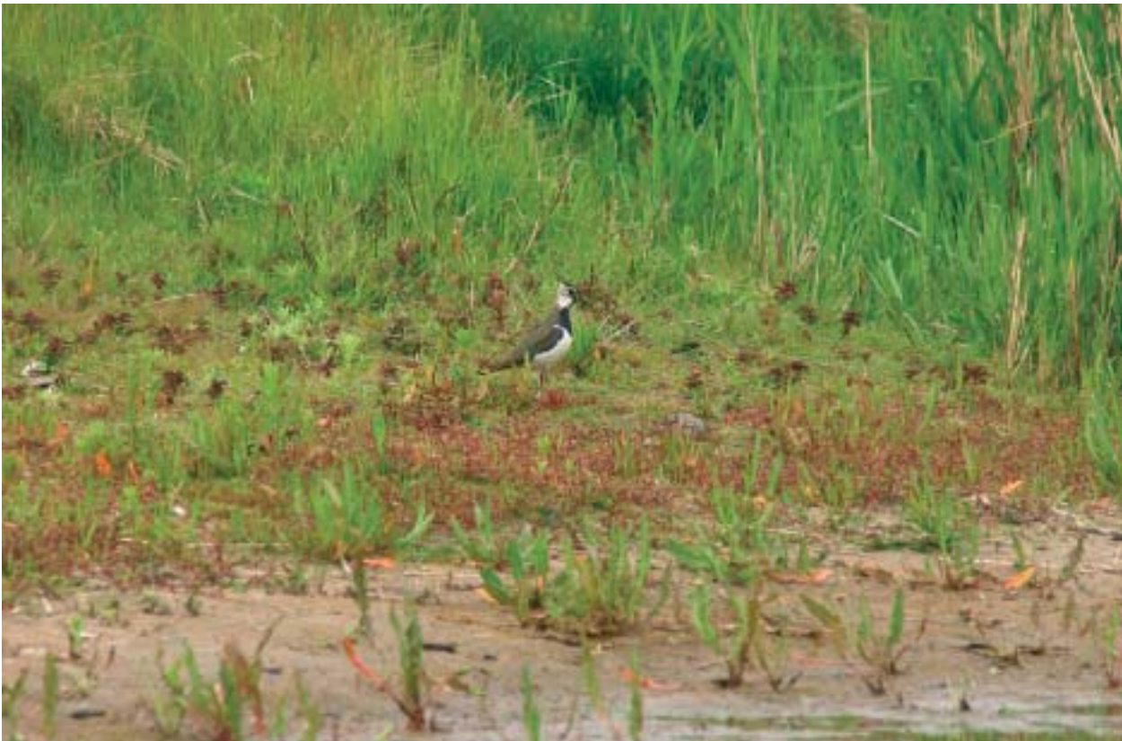
Foto 9: Van nature opdrogende poelen zijn niet alleen aantrekkelijk voor steltlopers, maar bieden tevens een goed kiembed voor tal van moerasplanten.