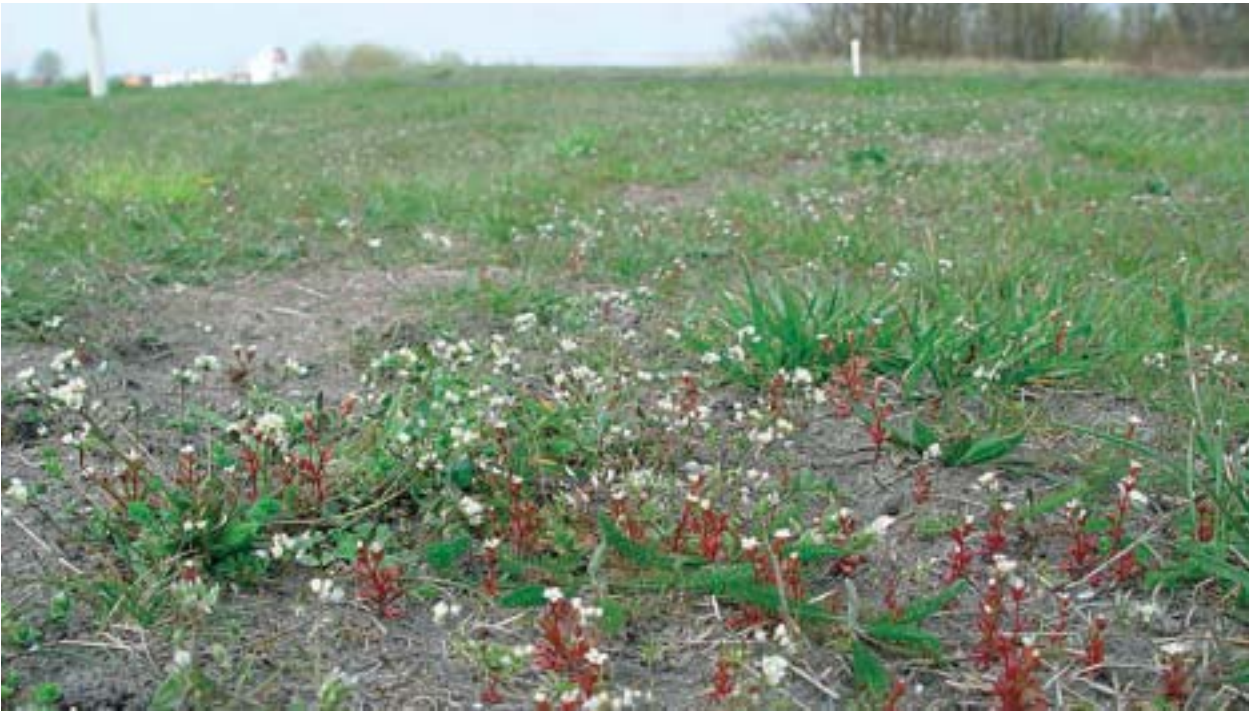
Foto 3: Bij het leggen van een nieuwe leiding is op deze leidingstrook een kale strook grond ontstaan. Meteen verschijnen er grote aantallen pioniersoorten, zoals hier kandelaartje en vroegeling.

Voorbeelden: strandplevier, bontbekplevier, kleine plevier, dwergstern, visdief, rugstreepad, smal vlieszaad en kandelaar.