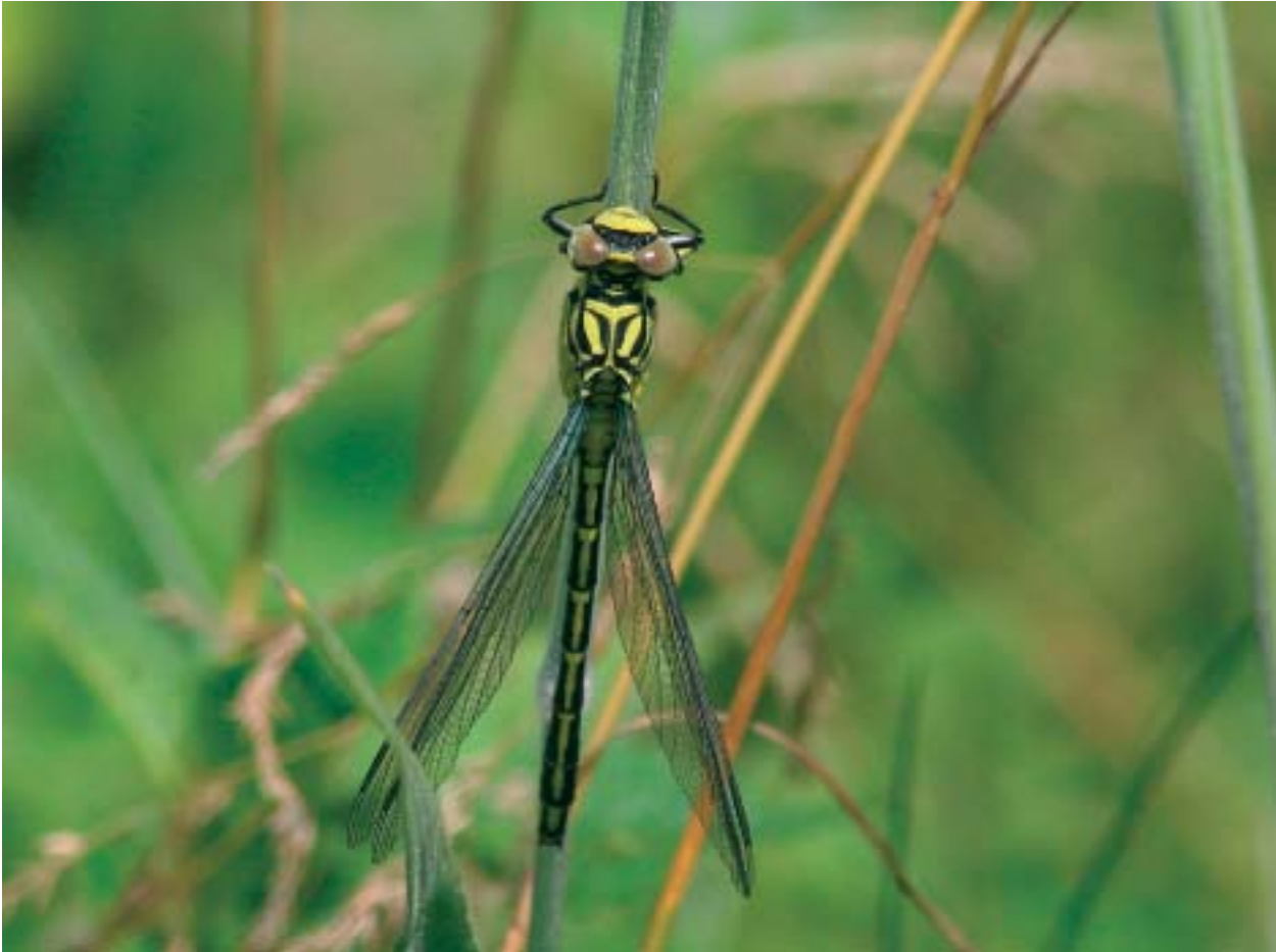
Foto 13: Rivierrombout is gebonden aan stromend water en is dus slechts een toevallige gast in tijdelijke natuur, bijvoorbeeld door daar te verpoppen of voedsel te zoeken.

zeggen en permanente kwel), sierlijke en oostelijke witsnuitlibel (vennen), grote vuurvliender (waterzuring in veenmosrietland), Spaanse vlag (warme beekdalen in Zuid-Limburg), gestreepte waterroofkever en brede geelrandwaterroofkever (laagveenplassen), vliegend hert, heldenbok en juchtleerkever (dood hout), muurhagedis (stenige landschappen), vleermuizen (oude bomen, gebouwen), hamster (graanakkers), geel schorpioenmos (kwelmoeras), langsteelmos (veen) en het mos Dicranum viride (stenen en beuken). Verder zijn soorten van open (zee)water, rivieren en beken niet te verwachten (gaffellibel, bronslibel, rivierrombout, zeeprík, beekprík, rivierprík, elft, fint, zalm, rivierdonderpad, bruinvis, dolfinen en het mos Dichelyma capillaceum ).