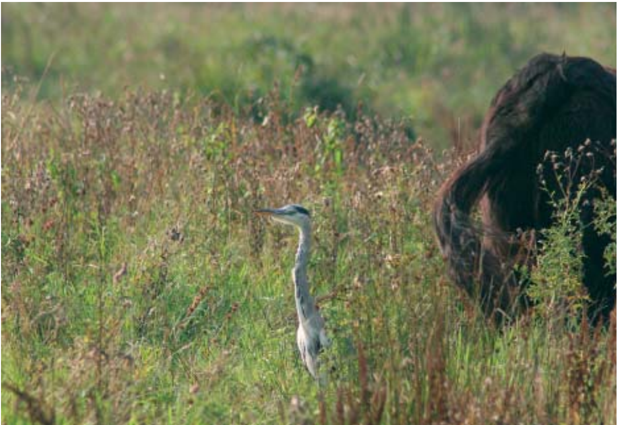
Foto 12: Reigers en roofvogels profiteren direct van het toegenomen aanbod aan muizen in ruige bloenrijke graslanden.

Afhankelijk van de bestaansperiode van een tijdelijk natuurgebied zijn er tal van soorten, vooral de echte pioniers, die al ruimschoots vertrokken zijn voordat de bulldozer zijn werk komt doen. Maar ook zo'n kort verblijf is voor de populatie als geheel van grote betekenis. Pionierplanten sturen na één geslaagd seizoen enorme aantallen zaden de wereld in. Amfibieën kunnen duizenden nakomelingen de wijde wereld in laten trekken na een geslaagde voortplanting. Vogels doen het wat rustiger aan, maar ook daarvoor geldt dat één geslaagd broedseizoen bijdraagt aan een grotere populatie het volgende jaar. Net als pioniersoorten, kunnen ook tal van vroege soorten al voor een definitieve inrichting reeds verdwenen of in aantal verminderd zijn. De winst van een tijdelijk natuurgebied zit hem in al die zaden en nakomelingen die zich naar de wijde omgeving verspreid hebben. En natuurlijk ook in de belevingswaarde die zo'n gebied heeft voor de mensen die er van willen genieten. Want hoewel dat buiten het bestek van deze studie valt, is ook dat een belangrijk aspect.