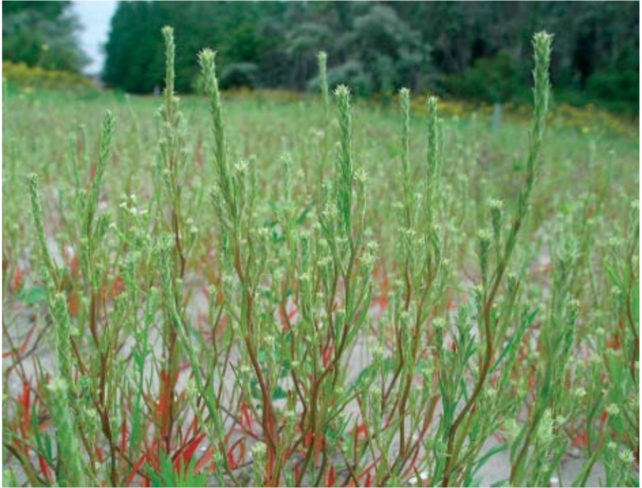
Foto 2: Sommige soorten, zoals smal vlieszaad, zijn juist te vinden op industrieterreinen die regelmatig op de schop gaan.