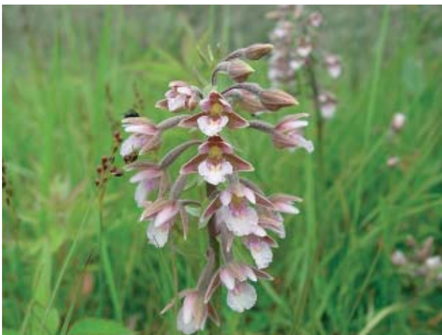
Foto 7: Moeraswespenorchis verschijnt pas als de juiste bodemschimmel aanwezig is en verdwijnt weer als zijn leefgebied overgroeid raakt door struweel.

Aan de kust in de directe nabijheid van duinen kunnen tal van bijzondere soorten opduiken, mede doordat populaties in de directe omgeving aanwezig zijn. Als kalkrijk zand opgespoten is ontstaan duinvallei-achtige begroeiingen op plekken waar zich in de winter regenwater verzamelt. Op de rand van droog naar nat verschijnen vroeg of laat orchideeën, waaronder mogelijk ook de groenknolorchis. Als zich na verloop van jaren struweel ontwikkelt op de randen van deze duinvalleien, dan kan ook de nauwe korfslak verschijnen.