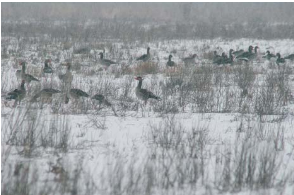
Foto 5: Tijdelijke natuur op voormalige akkers trekt de hele eerste winter lang ganzen aan die op oogstresten af komen.

aantallen grazende vogels aan, zoals zwanen, ganzen, smienten en meerkoeten. In tijdelijke natuurgebieden zijn deze soorten welkom en worden er niet verjaagd. Echter de voedselrijkdom neemt in tijdelijke natuurgebieden langzaam af en ruigte veelal toe. De draagkracht voor grazende vogels vermindert daardoor. Plasdras staande akkers of weilanden trekken grote aantallen steltlopers en eenden aan, maar missen het oppervlak om te voldoen aan de 1% norm. Tijdelijke natuur biedt hooguit enkele honderden hectares geschikt gebied tegenover vele duizenden hectares in de nu aangewezen gebieden.