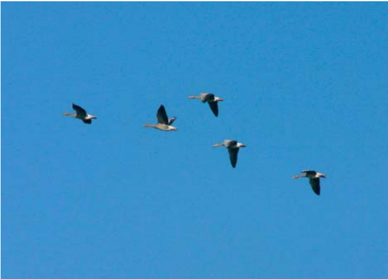
Foto 4: Voor de honderdduizenden ganzen die jaarlijks in Nederland doortrekken en overwinteren hebben we een internationale verantwoordelijkheid.

Hoewel diverse vleermuissoorten jaarlijks tussen nestkolonie en winterverblijf pendelen, is er weinig bekend over wat ze onderweg doen. Mochten doortrekkende vleermuizen tijdelijke natuur tegen komen, dan kunnen ze daar profiteren van de toegenomen insectenrijkdom. Trek van andere zoogdieren, zoals van grote grazers, is in het Europese laagland al sinds lang verdwenen. Vissen die tussen de zee en rivieren migreren zijn er wel (weer) in Nederland, maar hun biotoop ligt buiten tijdelijke natuurgebieden.