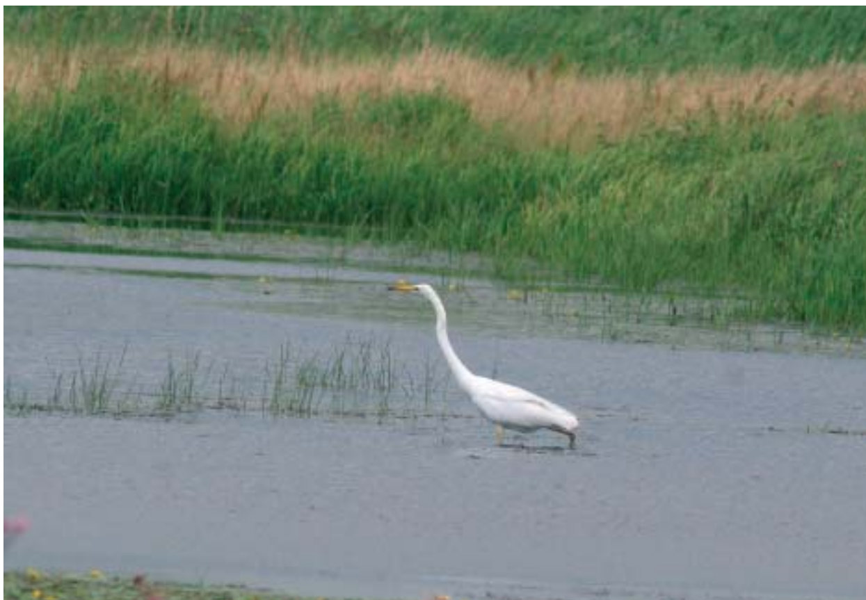
Foto 10: Reigers, zoals deze grote zilverreiger profiteren van jonge voedselrijke moerassen.

pad op hellinggrasland in Zuid-Limburg. Kwartelkoning, ooievaar, grote zilverreiger, purperreiger, kiekendieven en wilde kat kunnen hiervan profiteren. In schrale, natte, structuurrijke graslanden kunnen ook kemphaan en bosruiter verschijnen. In de omgeving van bestaande populaties kunnen beide pimperlblauwtjes opduiken en bloeiende populaties stichten. Omdat prooidieren als ree en haas toenemen, zou lynx hier in potentie van kunnen profiteren.