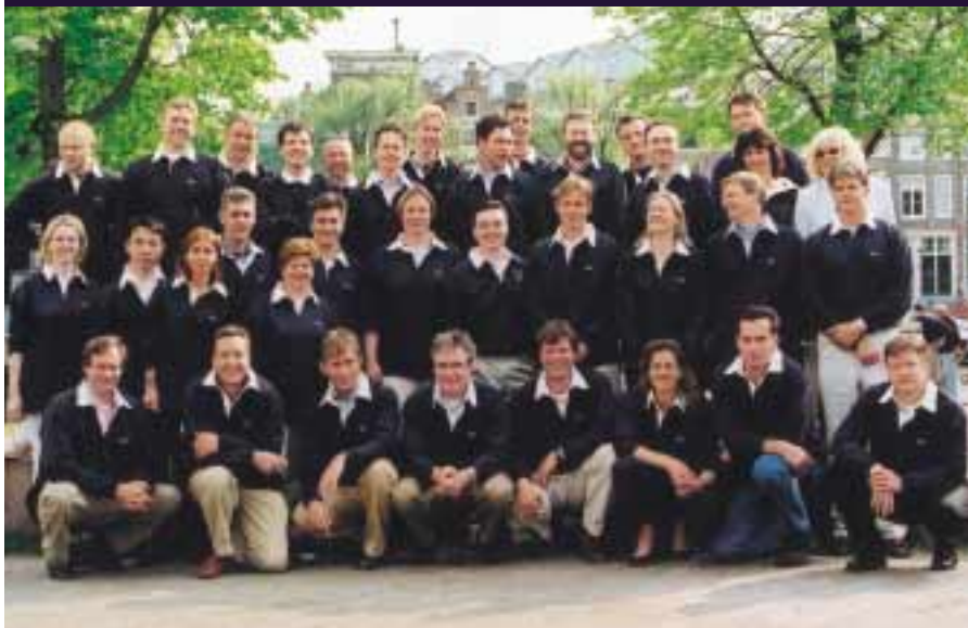
De internationale groep studenten van MAP 2 (juni 2001), samen met programmaorganisatie en trainers.