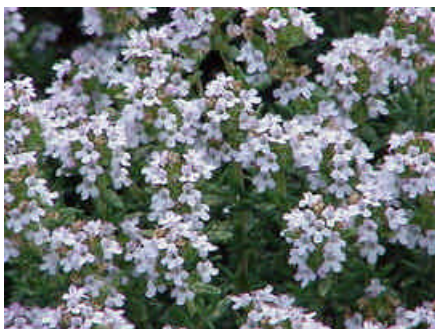
Thymus Vulgaris (tijm)