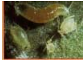
foto rechts: galmuglarve bezig met het leegzuigen van bladluizen