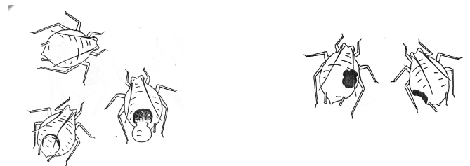
links: "goede" mummies