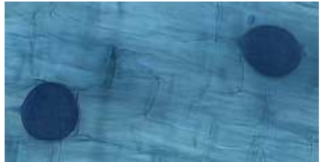
Mycorrhizaschimmels in de wortels van Witte klaver