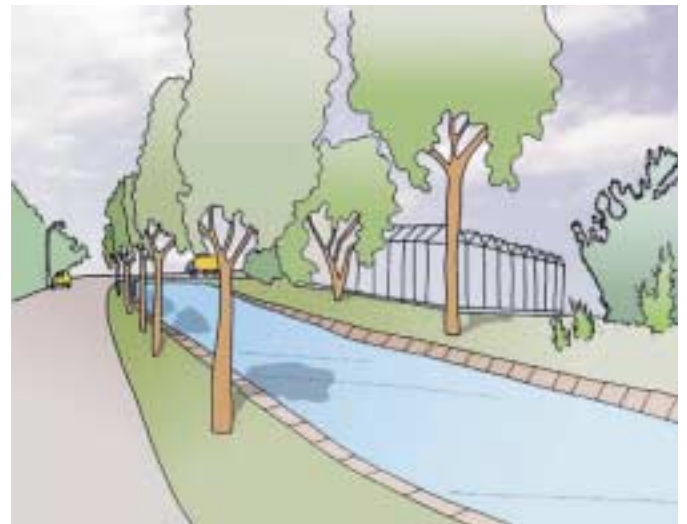
Biologische glastuinbouw in een ruimtelijk perspectief