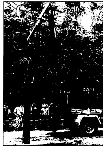
■ De toren van Pisa: concentratie bij het stapelen van scheefgezaagde stamstukken