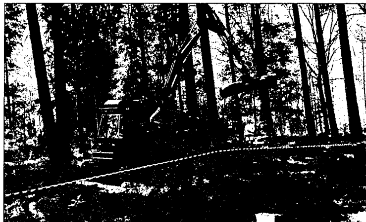
■ Het uitrijden van kisthout