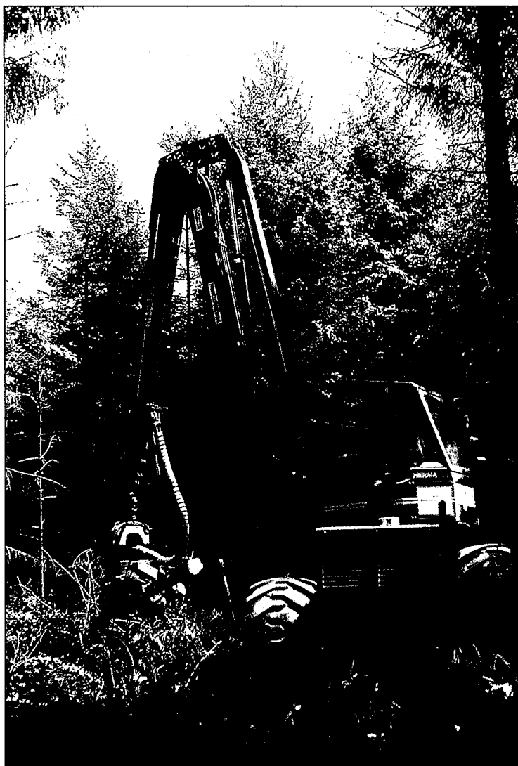
■ Demonstratie houtoogstmachine

Het is al meerdere decennia zo dat het bosbouwbedrijfsleven onder auspiciën van het Bosschap een nationale bosbouwmanifestatie organiseert. In 1956 en 1957 begon dat met demonstratiedagen in Drie en in De Steeg. In 1960 kwam er een 3-daagse "Bos en hout"-manifestatie van de grond die in 1967 werd gevolgd door een 3-daagse "Bos en mens" happening. Het was de tijd van nauwe samenwerking met organisaties als ANWB, IVN, KNJV, Natuurmonumenten, Houtinstituut TNO, die ook inzendingen verzorgden voor de tentoonstelling. De ANWB gaf toen zelfs nog een apart fotoboekje uit "ter herinnering aan de prettige samenwerking in de commissie Bos, Hout en Recreatiedagen 1967" compleet met foto's van een bezoekende Prins Claus en een toesprekende directeur SBB.