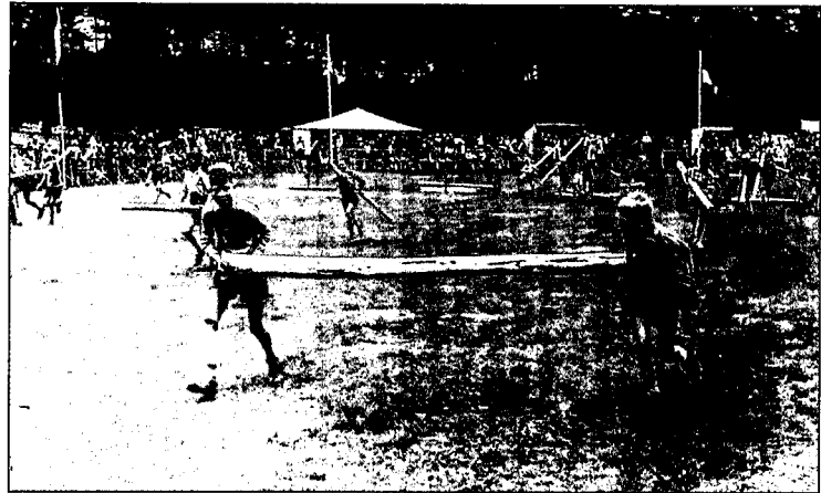
■ Een impressie van de Bos en Houtdagen in 1960: 't hout, de zaag, de man. Foto van de jeugddag op 15 juni.