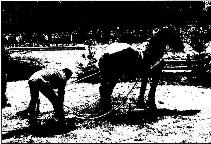
■ De voerlieden moesten voortdurend hout aankoppelen voor de volgende hindernis

Dat heeft een goede grond: het is hun vakmanschap die bepaalt of er effectief, veilig, tegen lage kosten en met zorg voor bos en hout wordt gewerkt. Uiteindelijk kan geen beleidsnota daar tegen op. Rondom die kern vindt een vakbeurs plaats en zijn er demonstraties. Nieuwigheden, van boscomputerprogramma's, via oogstmachines tot mobiele hout-oogstenergiecentrale zijn er te zien.