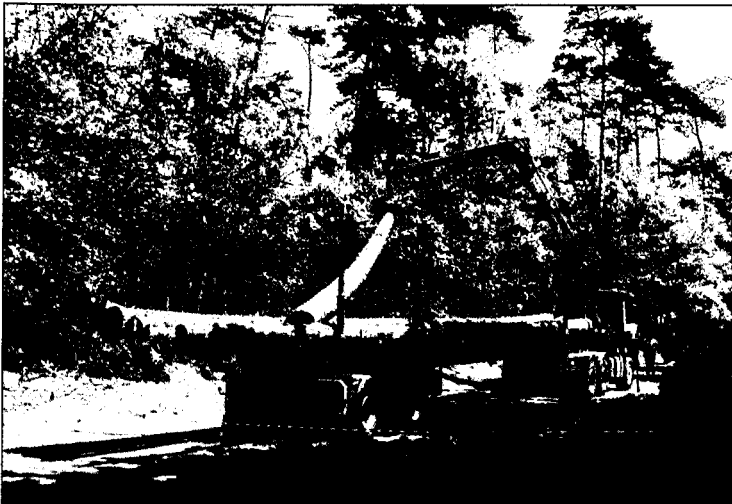
■ Het goed, veilig en snel laden van langhout