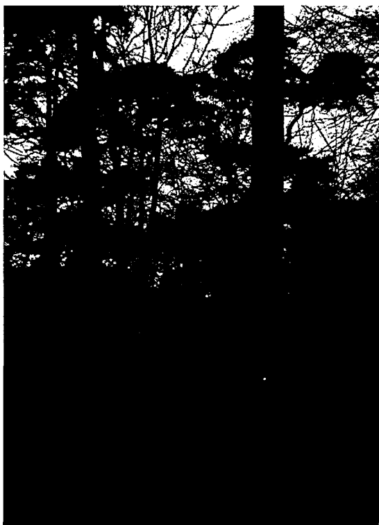
■ Toeslag voor inheemse soorten