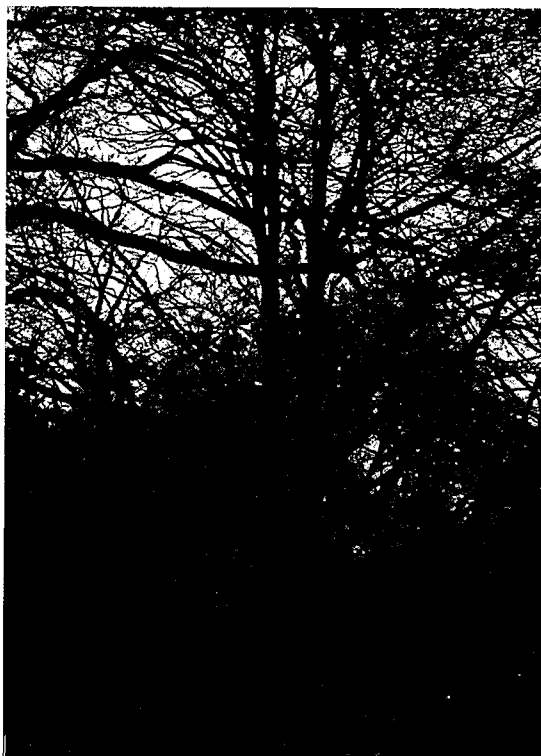
■ Toeslag voor dikke bomen

kenmerken die eenvoudig op het oog taxeerbaar zijn, worden in de regeling als toetsingscriterium gebruikt. Wat betreft proces- en structuurkenmerken gaat het daarbij om natuurlijke verjonging, schaal van de verjongingseenheden en de aanwezigheid van dikke en dode bomen. Wat betreft soortkenmerken gaat het om de verhouding tussen inheemse en uitheemse soorten.