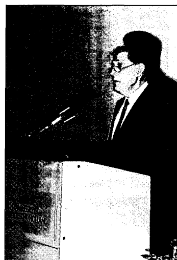
■ Dagvoorzitter Van Asperen: Koppeling stads- en bosuitbreiding.