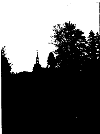
■ De kasteeltuin van het landgoed Frijsenborg

zijn de agrarische en bosbouwkundige dienstverlening sterk met elkaar verweven. Bovendien is het sterk van invloed op de manier waarop het bos beheerd wordt: de beslissingen worden voornamelijk ingegeven door economische motieven. Door deze vergaande integratie valt de particuliere bosbouw onder de verantwoordelijkheid van het ministerie van Landbouw.