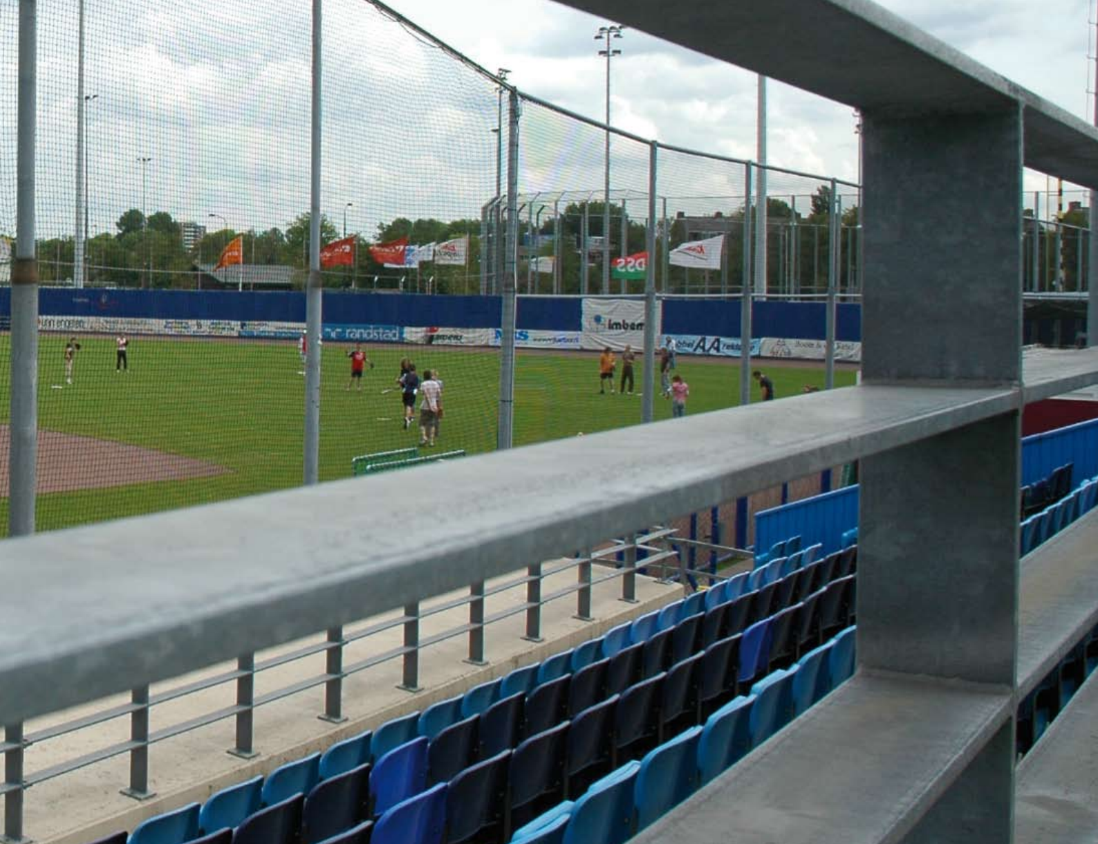
Het bestaande honkbalstadion in het Pim Mulier Park dat toebehoort aan honkbalvereniging Kinheim. Omdat er geen trainingsfaciliteiten waren, dreigde dit stadion zijn A-status te verliezen.