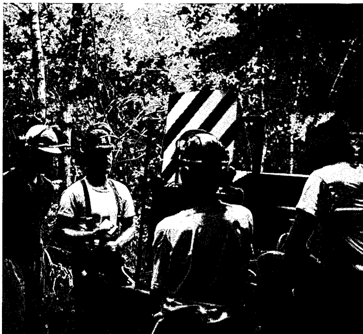
■ "Zagen kan iedereen, maar techniek beheersen niet".

De LSBC-cursus van twee jaar kost een leerbedrijf ongeveer 4000 gulden aan scholingskosten. Maar, benadrukt Brouwer, daarvan wordt 2800 gulden ge-