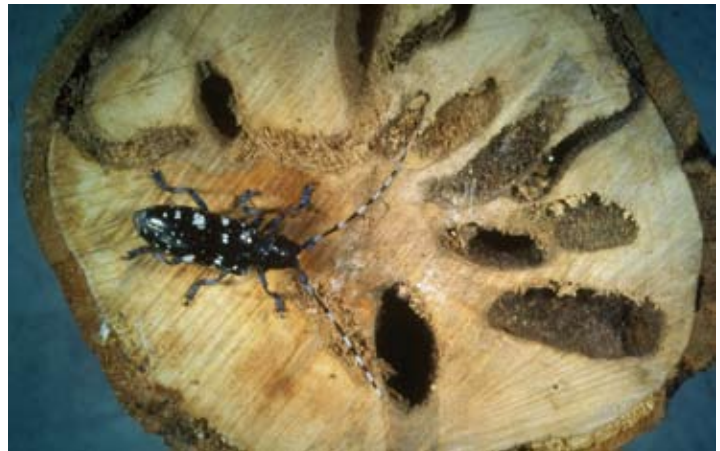
Fig. 4 De Aziatische boktor Anoplophora chinensis lijkt veel op de verwante soort A. glabripennis