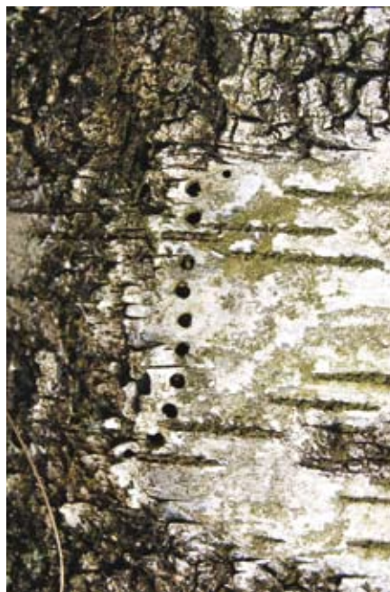
Fig. 6 Een rijtje ventilatiegaatjes van de berkenbastkever