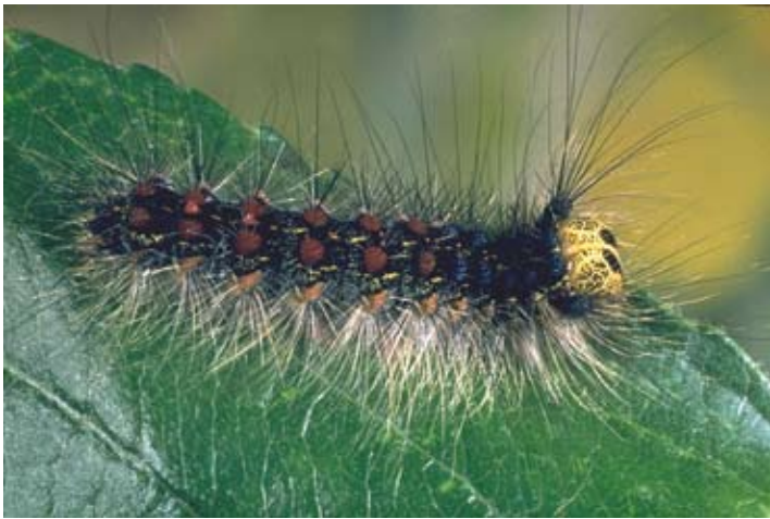
Fig. 3 Nooit eerder vertoond – plakker vreet wilgen kaal

De berkenbastkever Scolytus ratzeburgi komt voor bij de ruwe berk. Het vrouwtje maakt onder de schors een 10 centimeter lange moedergang met 'ventilatiegaatjes' die keurig in