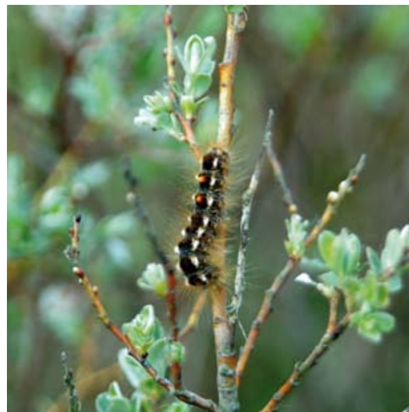
Fig. 8 Irriterende haren van de bastaardsatijnrups in duindoorn geven overlast aan recreanten