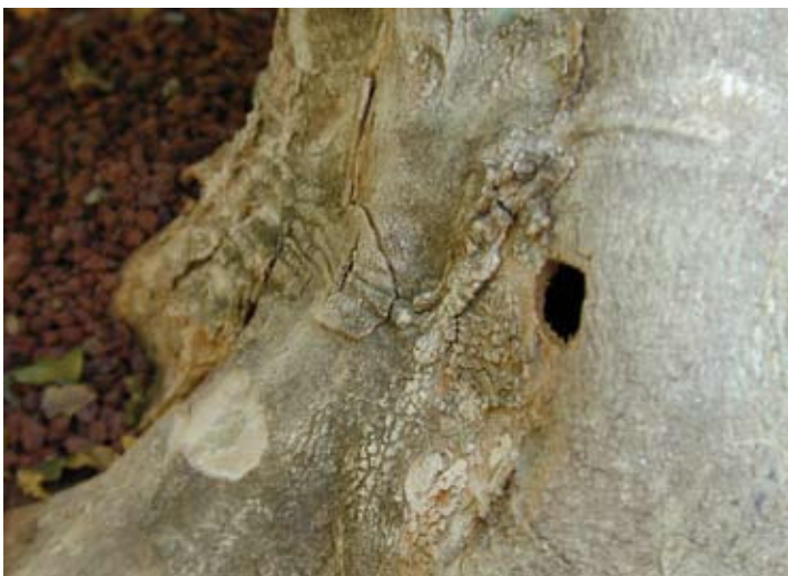
Fig. 5 Uitvlieggaten van de Aziatische boktor A. chinensis zitten in de stamvoet of in oppervlakkige wortels