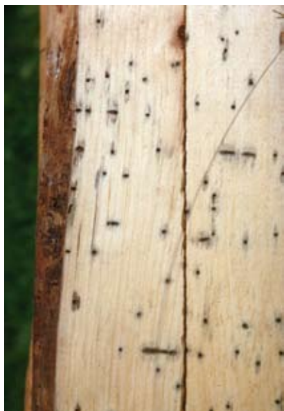
Fig. 7 De eikenhoutkever en andere ambrosiakevers maken diepe gangen in het hout van verzwakte eiken waar ze van zwarte schimmels leven