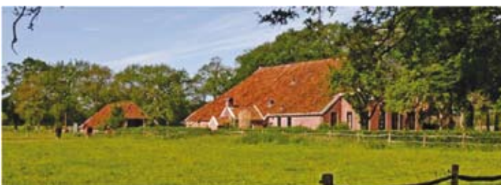
Door allochtonen hoog gewaardeerde landschappen

Het belangrijkste verschil is echter dat veel nieuwe Nederlanders vinden dat de natuur actief beheerd moet worden. Geen ruige natuur en het stimuleren van autonome processen in de natuur, maar een toegankelijke, bruikbare en verzorgde natuur is hun ideaalbeeld. Mogelijk vindt dat ideaalbeeld juist zijn oorsprong in de ontoegankelijkheid en ondoordringbaarheid van de 'grootse', ontzagwekkende natuur die ze kennen uit hun land van herkomst. Of zoals een Curaçaose vertelde: "In Nederland wordt de natuur veel beter beheerd, er wordt voor gezorgd, er zijn wandelpaden en dode bomen worden verwijderd. Op Curaçao is dat niet, daar moet je een pad creëren, een hakmes meenemen om je een weg door het bos te banen. Dus dat is een aanwinst."