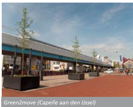
Green2move (Capelle aan den IJssel)

aan dat hij hoopt op een zeer extreme zomer, het liefst zo heet en droog mogelijk, omdat eventuele kinderziektes dan sneller boven water zullen komen.