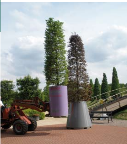
Boombakken zijn makkelijk te verplaatsen (Treesave).

Beide concepten worden via een full service aanpak op de markt gebracht. Blokzijl zegt het ronduit: “Ik verkoop nooit alleen de bak. Het gaat om de combinatie van bak, boom en beheer. Dat kun je niet los van elkaar zien.” Treeforyou heeft zelfs