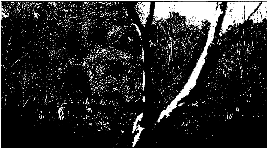
Duurzaam bosbeheer heeft de laatste jaren een bredere invulling gekregen

nale afspraken in hun nationale bossenbeleid en planningsprocessen zullen opnemen. In de praktijk is nog maar een beperkt aantal landen daadwerkelijk aan de slag gegaan. Ook de invulling verschilt van land tot land sterk, qua inhoud, proces, institutionele ophanging en politiek draagvlak. Het is de taak van het UN Forum on Forests (voorheen IPF/IFF) om verdere voorstellen uit te werken voor de praktische vormgeving van het nfp-concept en om landen te stimuleren en te ondersteunen bij het opstellen van hun eigen bossenprogramma en bij het versterken van hun bossensector.