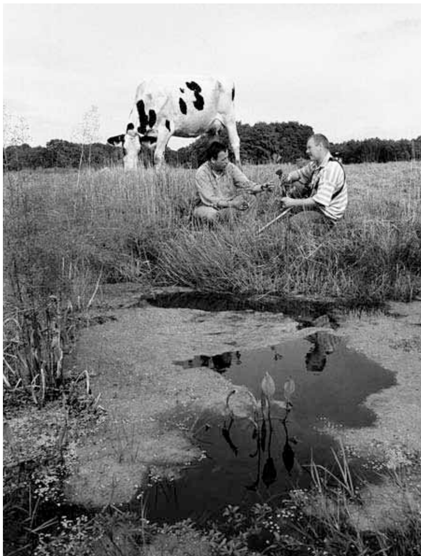
In het begin wisten beheerders niet waar ze aan toe waren als ze aan natuurbeheer wilden doen.

onvoldoende zekerheid is of de beheerssituatie in het Staatsbosgebied en van het centrale gebied in de gehele beheersperiode zal blijven voortbestaan. Het gebied van Staatsbosbeheer levert dus onvoldoende zekerheid op! De provincie wil dat het beheer van het andere gebied over een paar jaar na afsluiting van de proefperiode door het Programma Beheer wordt overgenomen. Voor de praktisch ingestelde agrariërs is de reden van afwijzing niet te volgen. Om deze reden dreigt op dit moment het beheer van enkele honderden ha onmogelijk te worden gemaakt. De natuurvereniging heeft hier tegen in november 2000 bezwaar gemaakt. Deze bezwaarprocedure is 14 maanden later(!) nog steeds niet afgerond.