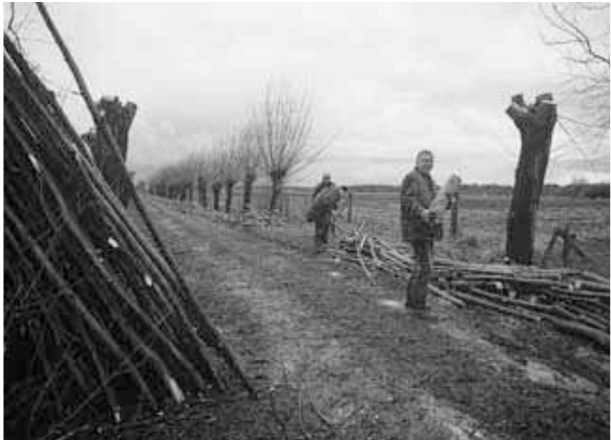
Bij de uitvoering van het natuurbeleid zijn honderden vrijwilligers betrokken.

Het indienen van een aanvraag voor de regelingen van Programma Beheer is geen sinecure. De beheerder dient een