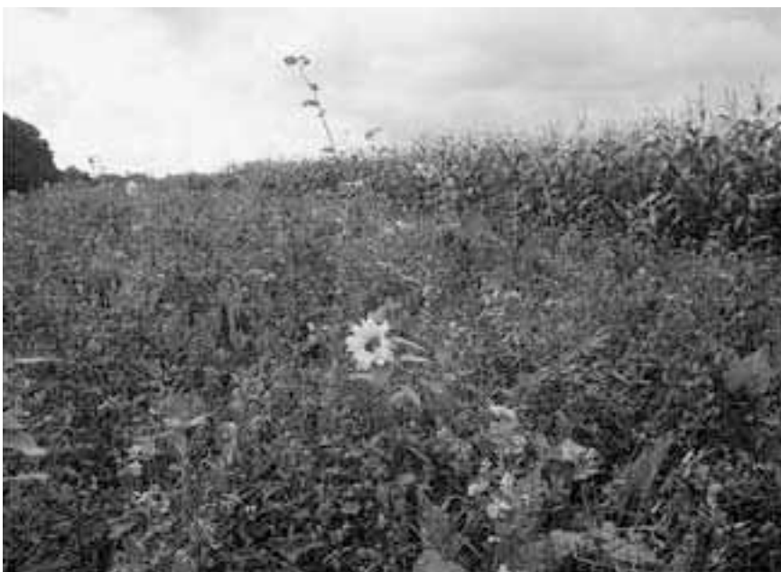
Resultaatbeloning is een belangrijke verbetering in Programma Beheer.