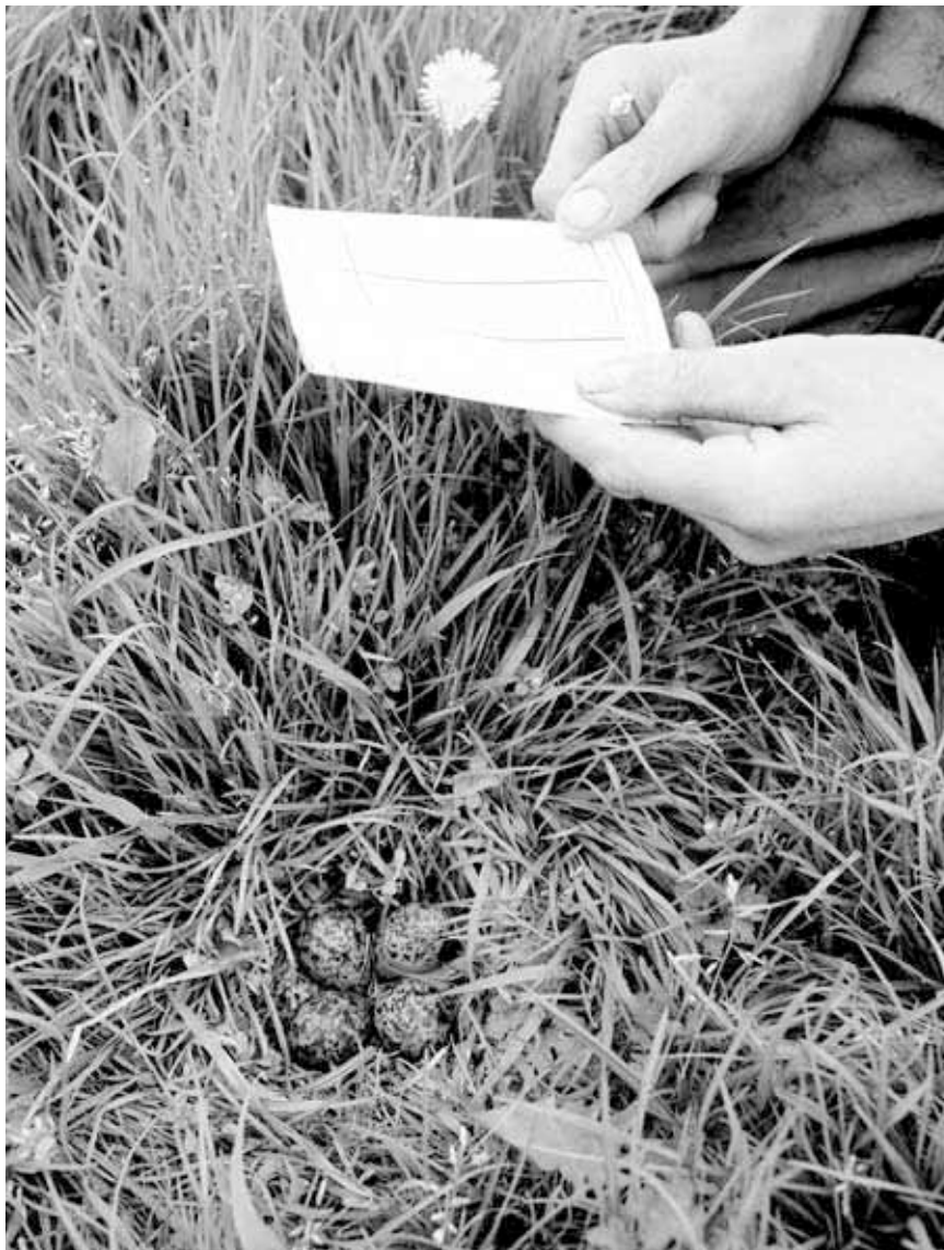
Zolang er geen definitief "ja" van de overheid was, waren alle risico's voor de ondernemer.

De overheid heeft aangekondigd de beheerregelingen na drie jaar te evalueren. Inmiddels is er door LNV ambtelijk