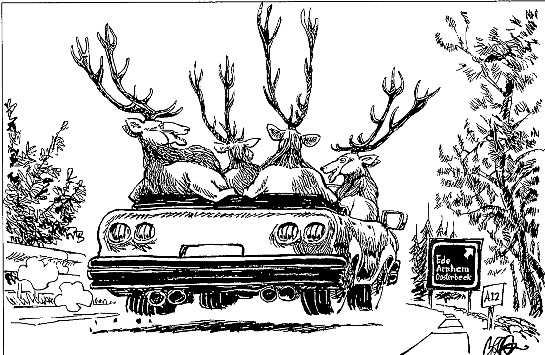
Titel: Hert over de weg Bron: Jos Collignon, 1998 (opdracht voor LNV Directie Oost)

middels niet stil gezeten. Eind 1998 presenteerden zij op een door LNV Directie Oost en provincie Gelderland georganiseerd bestuurlijk overleg de "Eindeloze Veluwe". Daarin geven ze hun visie op de inrichting en het beheer van de zuidwest Veluwe en hun inspanningen voor een samenhangende ecologische ontwikkeling ervan. Het proces begint duidelijk van twee kanten te lopen!