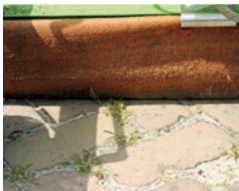
De hoogte stel je zó in, dat het doek net boven de verharding hangt. Dit doe je door de twee stelwielen in hoogte te verstellen.