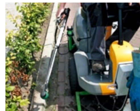
Met de laagvolumespuitlans kun je lastige hoekjes en kantjes bereiken.