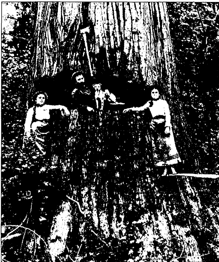
Als de boom valt is het voor participatie te laat

uitgezet maar het succes is nog marginaal. Ook voor bos is het belangrijk dat de boerennatuur slaagt. Immers 40 % van de beleid voor de bosuitbreiding is afhankelijk van de wil van boeren om te bebossen. In de periode 1990-1995 was het boerenbos redelijk succesvol, maar de eerste tekenen wijzen op een afname van nieuwe aanvragers.