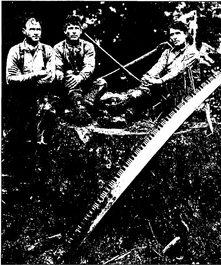
De houthakkersromantiek is verdwenen, nu moeten ook andere functies aan het bosbeheer meebetalen

spectief is sinds het Meerjarenplan Bosbouw met succes gewerkt. Maar een Impuls voor een nieuw perspectief in de 21-ste eeuw ontbreekt.