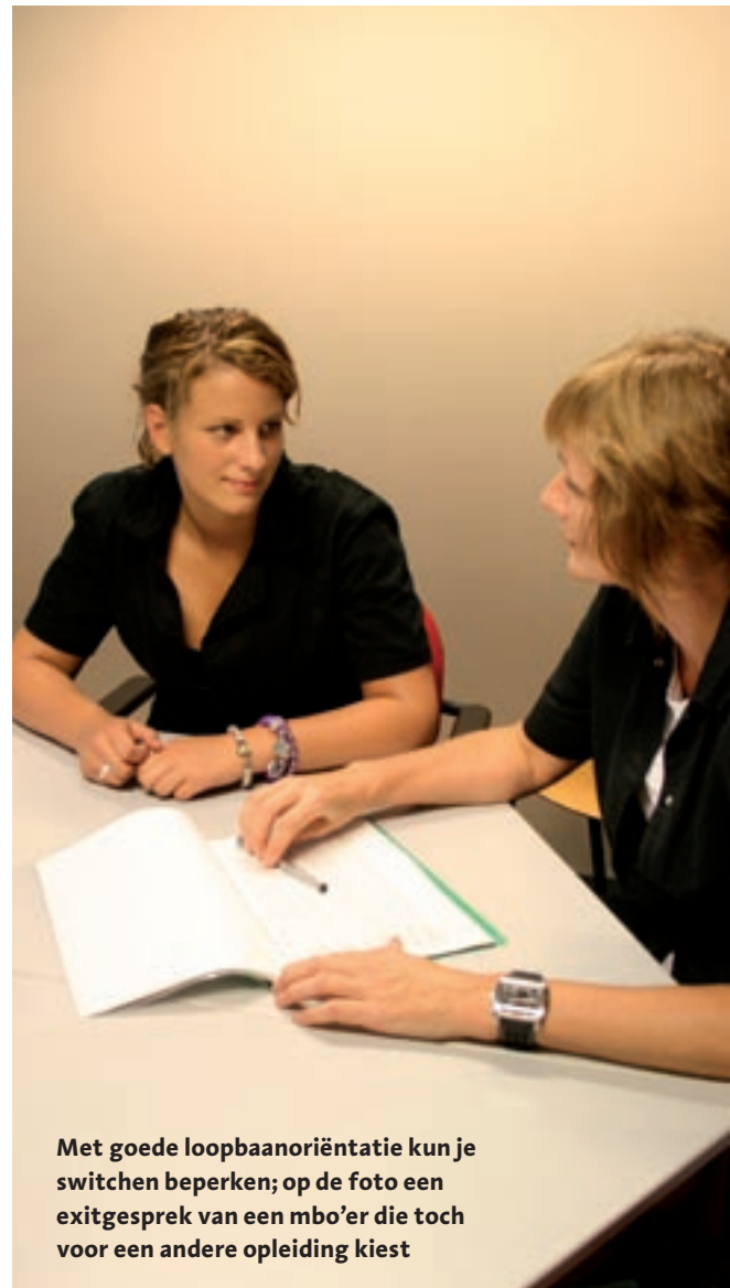
Met goede loopbaanoriëntatie kun je switchen beperken; op de foto een exitgesprek van een mbo'er die toch voor een andere opleiding kiest

meld bij de RMC. De RMC-consulenten kunnen niet verplichten, maar ze zetten zich in om de jongeren alsnog naar een startkwalificatie te begeleiden.