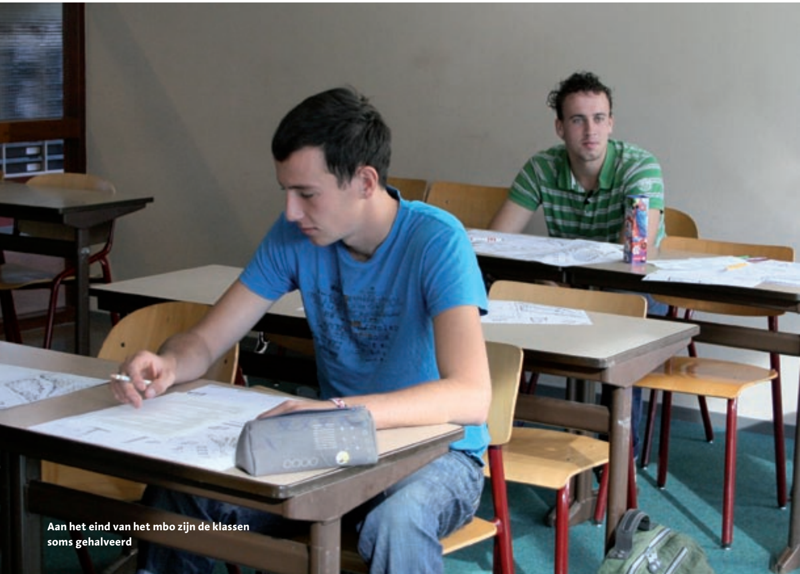
Aan het eind van het mbo zijn de klassen soms gehalveerd

Overheid en scholen spannen zich al jaren in om schooluitval te beperken. Maar wanneer is er eigenlijk sprake van schooluitval, waarom stoppen jongeren met school en hoe zit dat in het groene onderwijs?