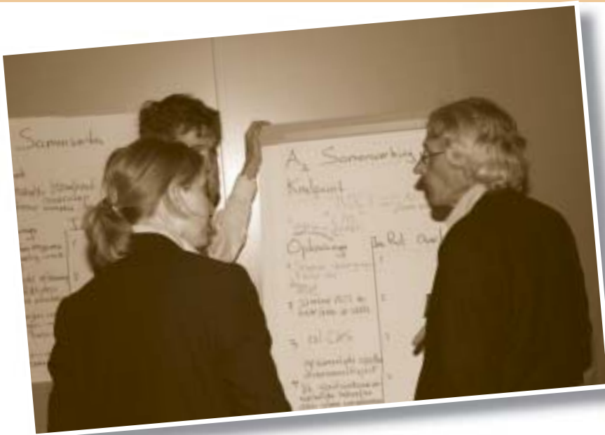
◀ Rode en groene stickers plakken bij de stellingen uit de workshops

ken neer. “Je moet geloven in je eigen kracht en de regio opzoeken.” Zo ziet hij kansen in samenwerking met het groene hbo. Niet zo direct voor doorstroom – dat levert hem immers geen nieuwe leerlingen op – maar door de afstroom. “Nogal wat eerstejaars hbo-studenten vallen in het eerste jaar uit. Zoals havisten. Dat komt vaak omdat ze in het voortgezet onderwijs een te hoog advies hebben gekregen.” AOC Limburg biedt deze afstromers onderdak zodat ze een groene mbo-kwalificatie krijgen en mogelijk beter geëquipeerd alsnog hun hbo-route kunnen vervolgen.