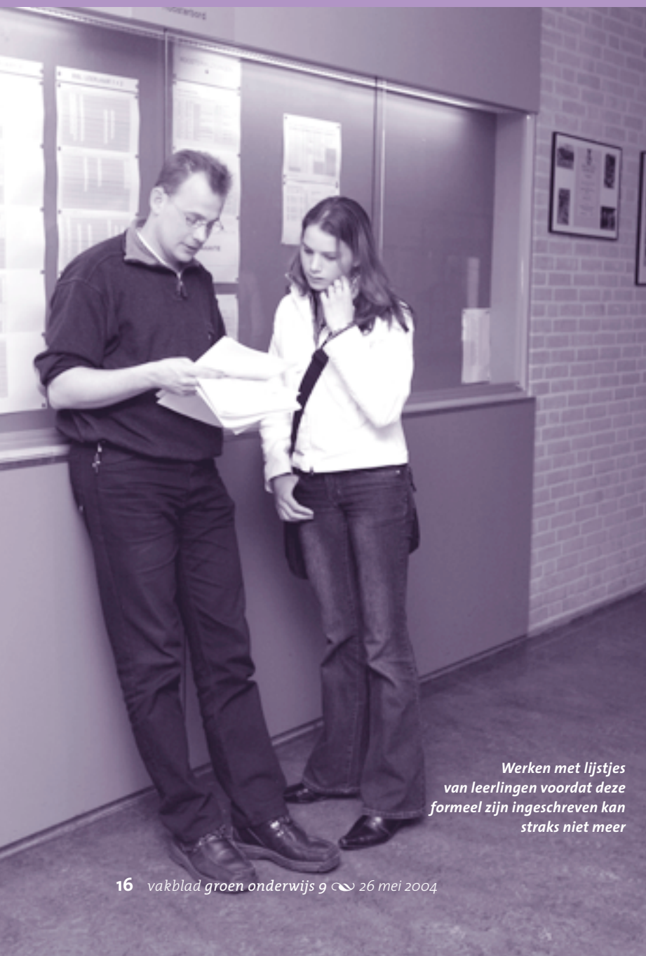
Reeds jaren hebben de aoc's ervaring in het jaarlijks geautomatiseerd aanleveren van bekostigingsinformatie aan hun financier, het ministerie van LNV, maar er zijn veranderingen op komst. Het Persoonsgebonden Nummer (PGN) doet zijn intrede.

Werken met lijstjes van leerlingen voordat deze formeel zijn ingeschreven kan straks niet meer