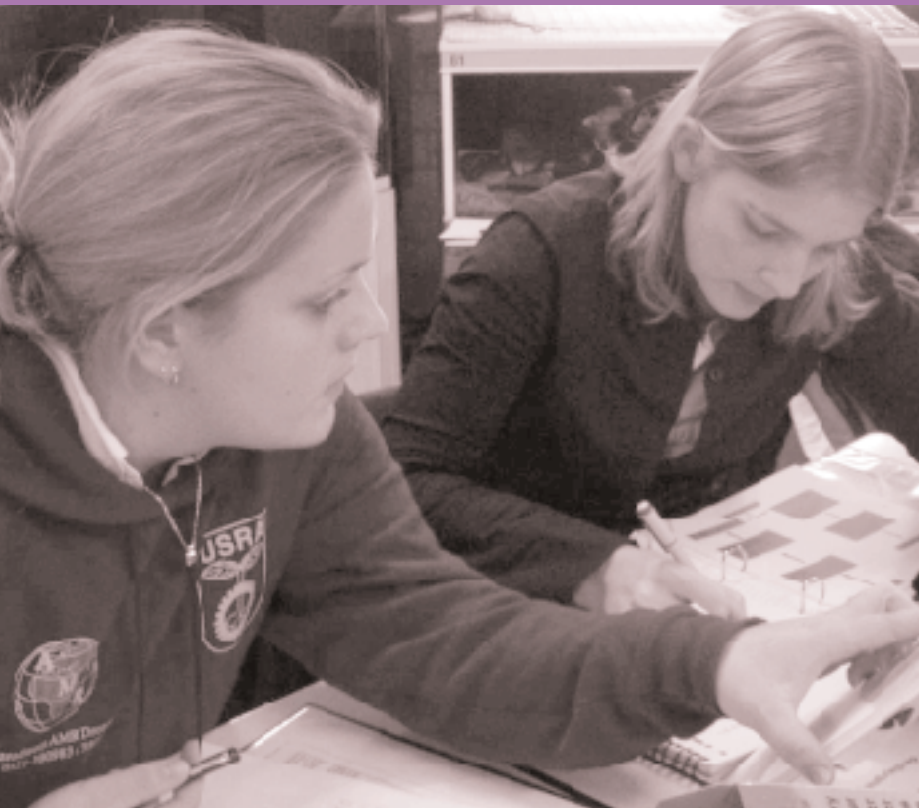
FOTON VAN DEN BORN

PTC+ en de Stoas Hogeschool willen graag een competentiegerichte onderwijsweek die past in het programma van de Stoas-studenten. Eind november was er zo'n week, tegelijk in Barneveld en Oenkerk. De praktijk blijkt dan nog niet helemaal overeen te komen met het ideaal.