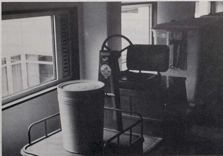
Transport verrijdbare polyester verzamelcontainers en afgesloten tonnetjes.