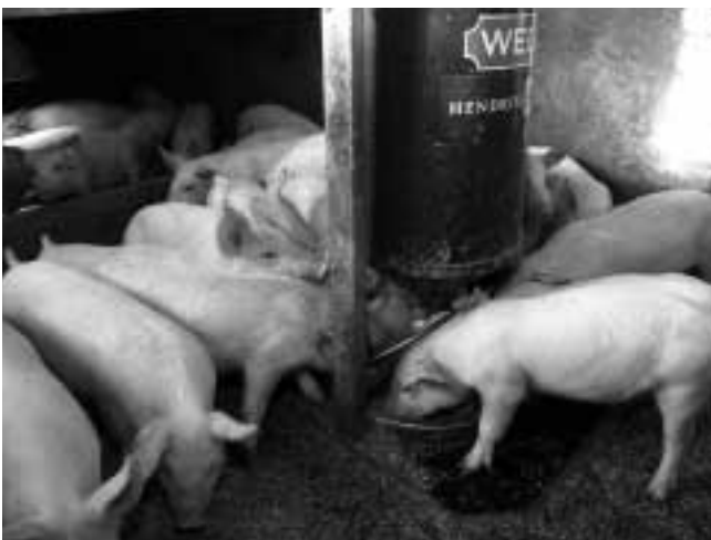
Afb. 1. Vloeibaar voer in de eerste twee weken na spenen kan de voeropname met 50 % verbeteren

Dit artikel is een samenvatting van de inleiding die gehouden is op de sectordag varkenshouderij van 2 april jl.