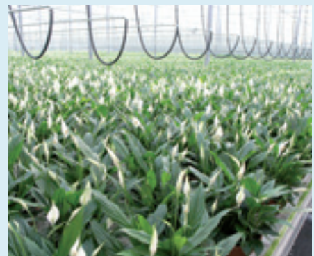
Het onderzoek naar groeioptimalisatie in potplanten vindt onder andere plaats bij Spathiphyllum.