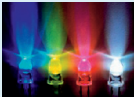
Bij blauw licht maken planten kortere internodiën.

Onlangs is een onderzoek gestart naar toepassing van stuurlicht om daarmee