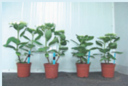
Het aanraken van planten gaf een groeiemring van 25%.

Groeiemring vindt vooral plaats met behulp van chemische remmiddelen. In de nabije toekomst is de verwachting dat er sectorbreed, in de gehele plantenteelt problemen ontstaan omdat het gebruik van chemische groeiemmers steeds