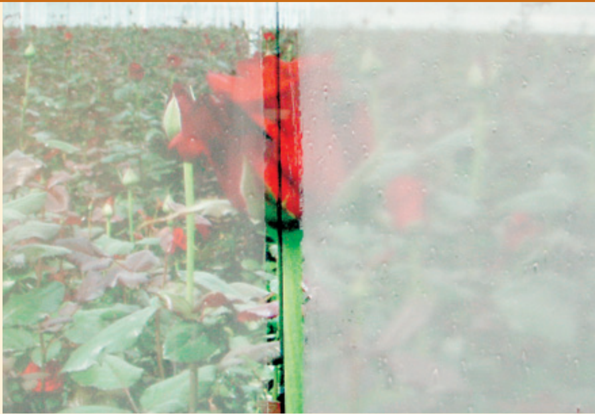
Een scherm op basis van ReduHeat (links) is duidelijk transparanter dan gewoon krijt (rechts).

In warme streken wordt het middel vroeg in het voorjaar aangebracht om een gelijkmatiger teeltklimaat te krijgen met diffuus licht en minder scherpe overgangen. Kroeze vervolgt: "Vergeleken met vorig jaar hebben we ruim het tienvoudige verkocht. Dat had nog meer kunnen zijn, maar we hanteren bewust de handrem. Wanneer iedereen het middel naar eigen inzicht toepast, krijg je onherroepelijk problemen. In augustus inventariseren we de resultaten in verschillende teelten en dragen we de kennis over aan praktijkvoorlichters. Dan trekken we ons plan voor volgend jaar."