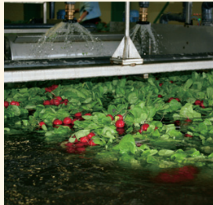
Op jaarbasis 10 miljoen bosjes.