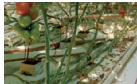
Meten van emissie van spuitvloeistof naar de grond met collectoren.

De hoogste spuitdop moet maximaal 40 cm onder de top van de plant zitten. Dan wordt ook bij een horizontale stand van de spuitdop de top van de plant geraakt. Het watergevoelig papier (zie schema), dat na bespuiting met water van geel in blauw verkleurt, geeft aan dat bij de