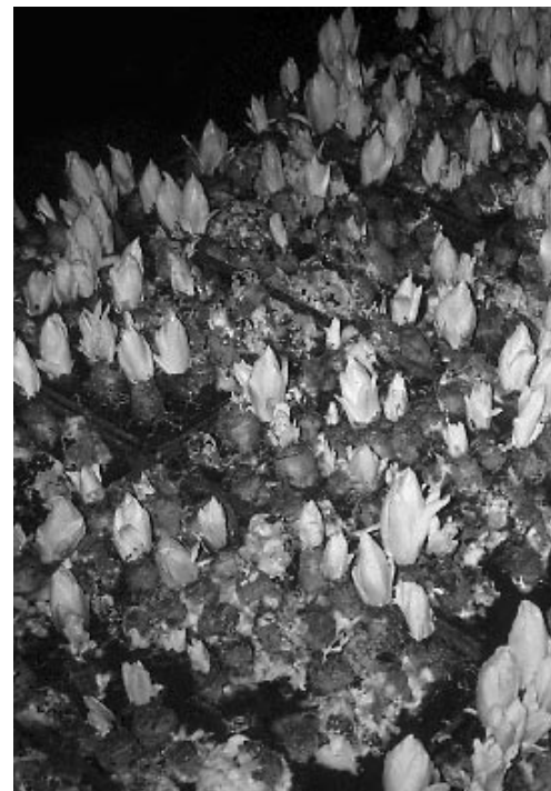
Zeer sterke aantasting van witlof door Sclerotinia sclerotiorum tijdens de trek.

jaren, in samenwerking met het PAGV (Ir. G. van Kruistum) en het ROC de Waag (P.O. Bleeker en C. Schouten), semi-praktijkproeven uitgevoerd met witlof. In principe werden de pennen op dezelfde wijze behandeld als in gangbare systemen, echter met toediening van een sporensuspensie van C. minitans in plaats van een fungicide. De resultaten waren overtuigend: in twee van de drie proeven